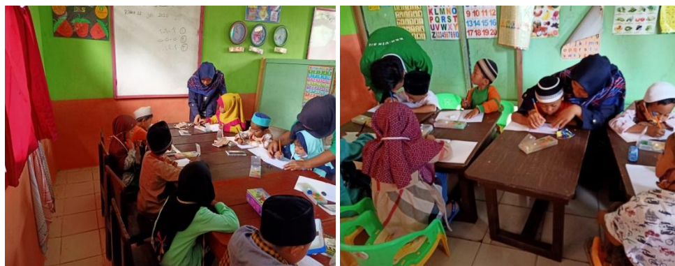
Gambar 2.3 pendampingan belajar siswa/i TK