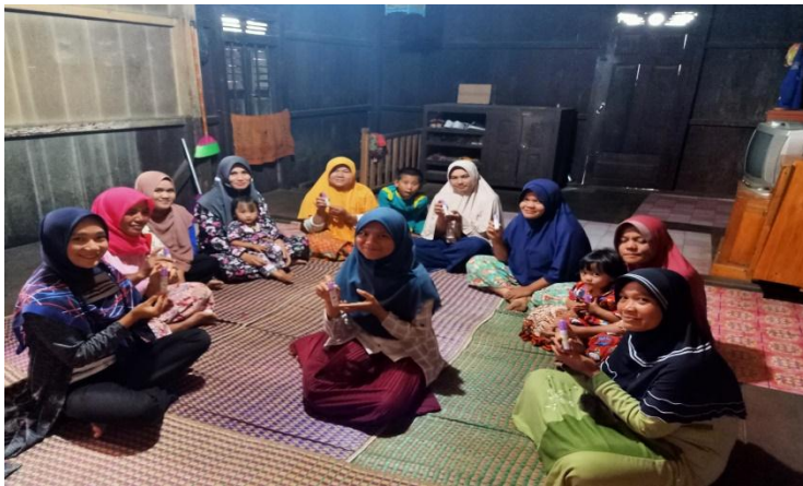
5. Pembagian handsanitizer kepada masyarakat desa hujung