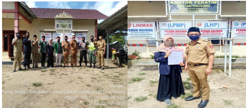
Gambar 2.1 penyuluhan mengenai wabah covid-19