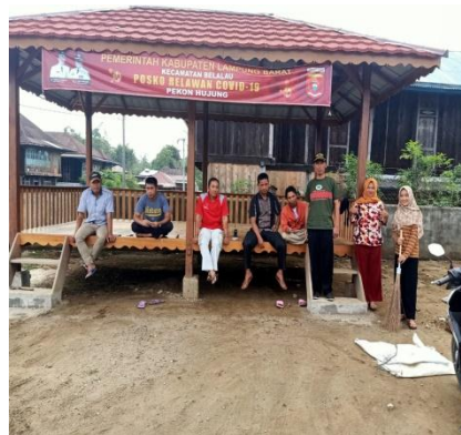
Gambar 2.6 kegiatan bersih-bersih lingkungan