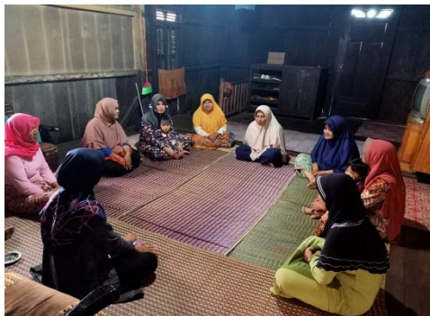
Gambar 2.4 pembuatan handsanitizer menggunakan bahan herbal