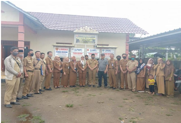
4. Kegiatan rapat koordinasi (rakor) dan monitoring evaluasi (monev) desa hujung