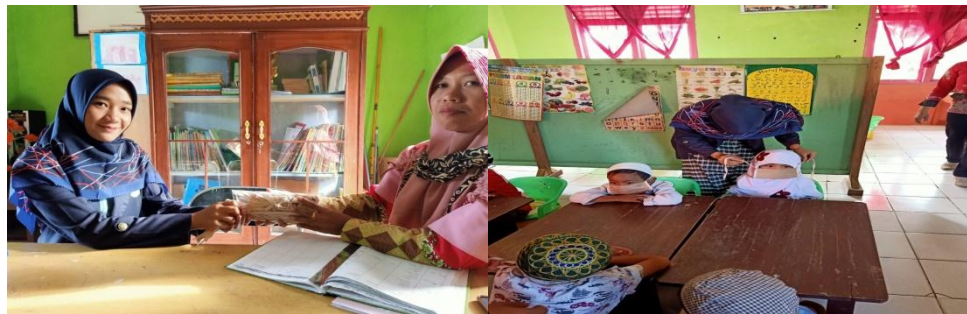
Gambar 2.2 pembagian masker