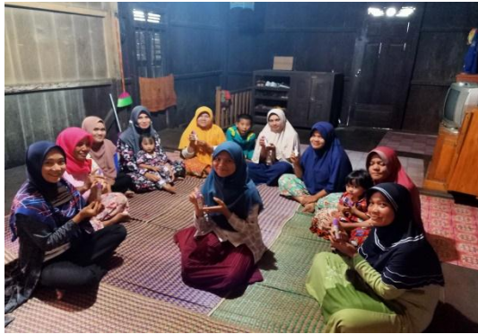
Gambar 2.5 pembagian handsanitizer