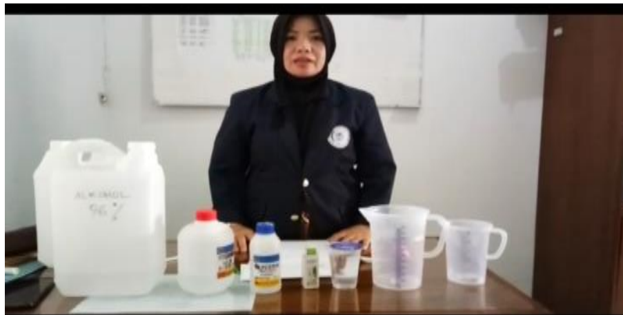
Gambar 10 Pembuatan Hand Sanitezer