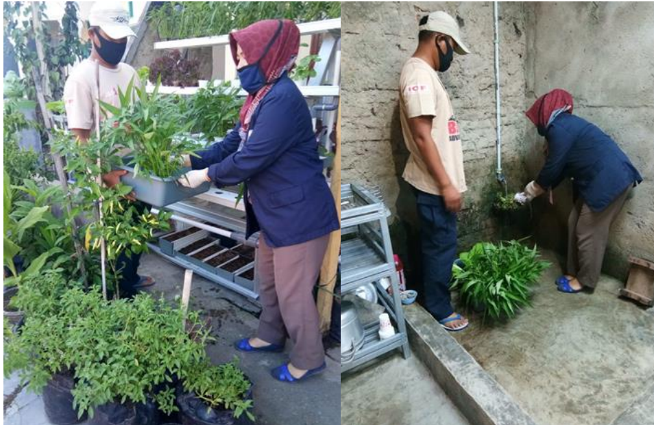
Gambar 2.1 .

Pemanenan Sayuran sebaiknya dilakukan pagi atau sore hari untuk mengurangi susut bobot akibat transpirasi yang diakibatkan panas sinar matahari. Setelah pemanenan dilakukan 'curing', yaitu menyimpan sayuran di tempat teduh untuk beberapa saat agar kalor akibat panas matahari saat di lapang hilang. Hasil sayuran yang di panen di cuci dengan air mengalir agar kotoran dan sisa – sisa Pesticida yang menempel pada sayuran hilang.