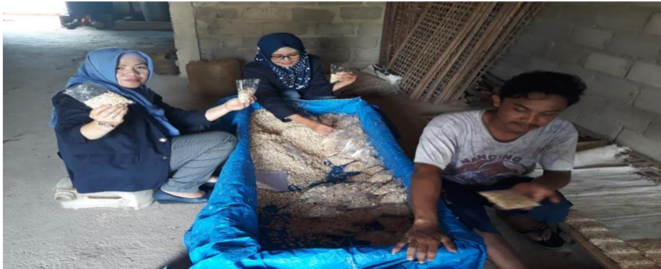
Gambar 9 UMKM Tempe