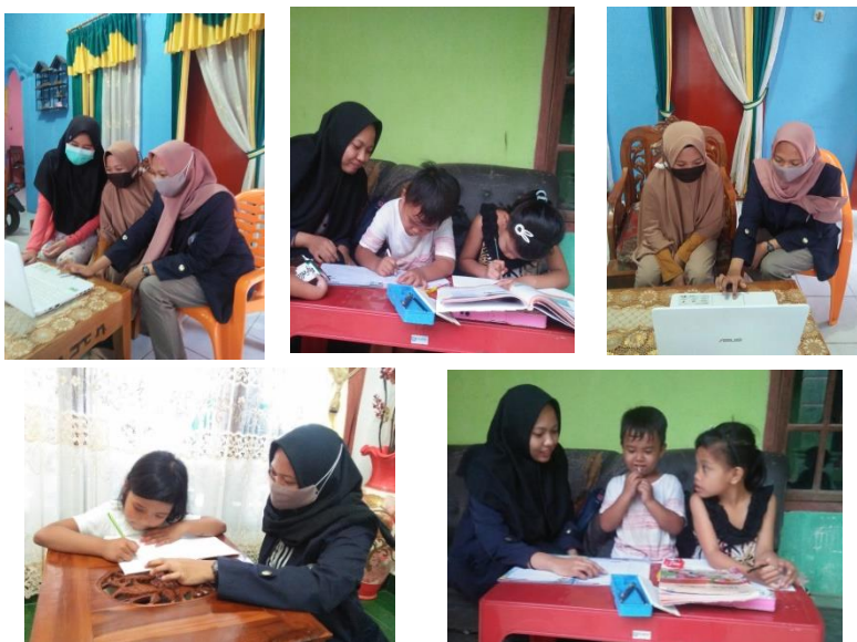
Gambar 2.3 Melakukan pendampingan pembelajaran