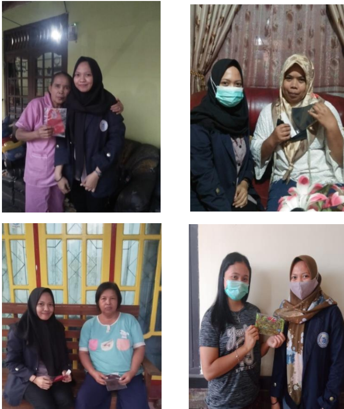
Gambar 2.2 Menyalurkan Alat Pelindung Diri (APD) berupa masker