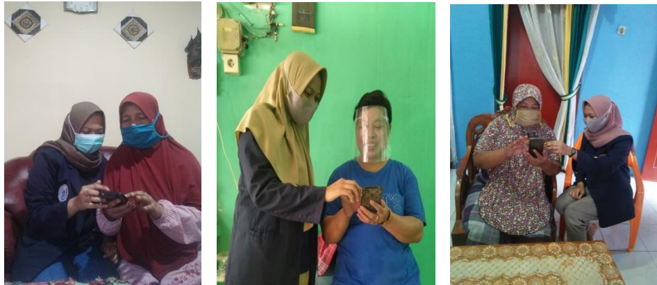
Gambar 2.4 Melakukan pengenalan e-commerce kepada masyarakat