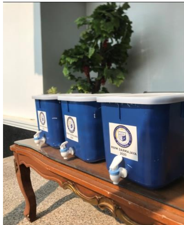
Sosialisasi dan pembagian tempat cuci tangan