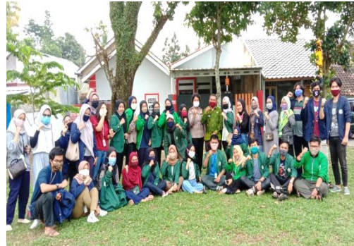
Rapat acara kegiatan Kampung Tangguh