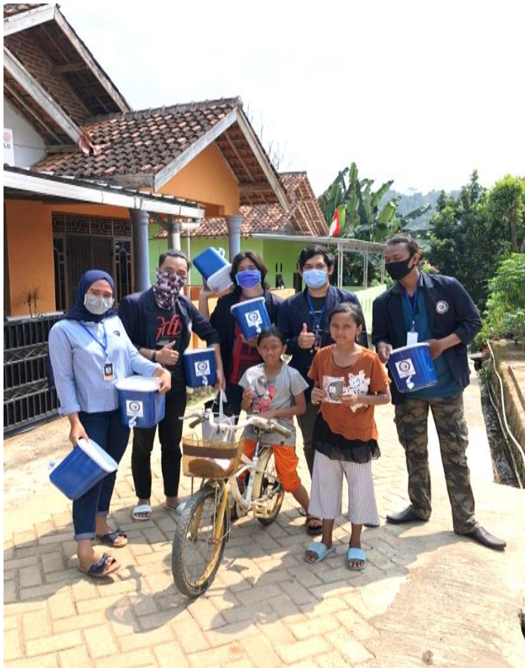
Pembagian masker dan handsanitizer