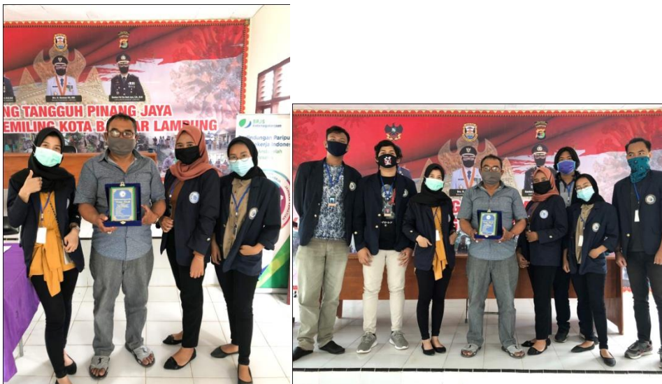
Pelepasan bersama bapak lurah pinang jaya