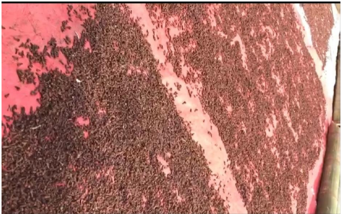
Kunjungan ke UMKM