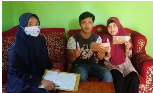
Gambar 6. Membagikan masker dan handsanitizer

Membagikan masker kain dan handsanitizer sesuai dengan imbauan dari WHO semua orang wajib memakai masker setiap berada diluar ruangan maupun di lingkungan rumah. Masker yang dibagikan itu sebagai upaya memutus mata rantai dari penyebaran virus corona di desa Sadar Sriwijaya.