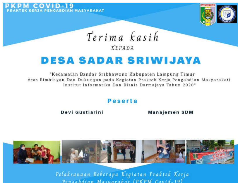
Gambar 6. Tanda Terimakasih untuk desa Sadar Sriwijaya