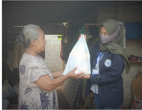
Gambar 9. Membagikan sembako kepada warga