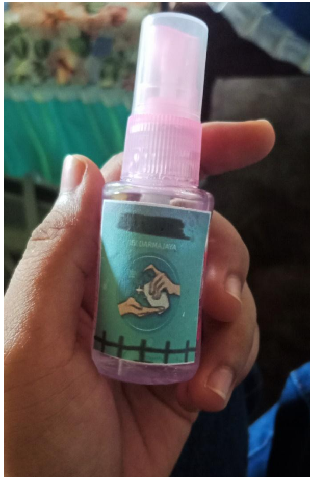
Gambar 4. Handsanitizer yang telah dibuat