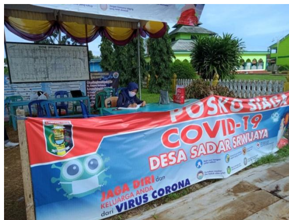
Gambar 3. Menjaga posko Covid-19

Kegiatan pengecekan suhu tubuh ini dilakukan untuk mengetahui keadaan suhu tubuh masyarakat guna mengantisipasi penularan dan penyebaran virus corona (Covid-19) di lingkungan desa Sadar Sriwijaya. Selama pengecekan suhu tubuh ini berlangsung tidak ditemukan warga yang teridentifikasi tanda-tanda terkena Covid-19.