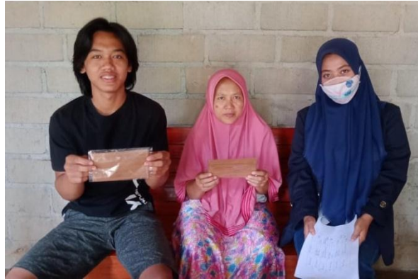
Gambar 5. Penyuluhan Covid-19