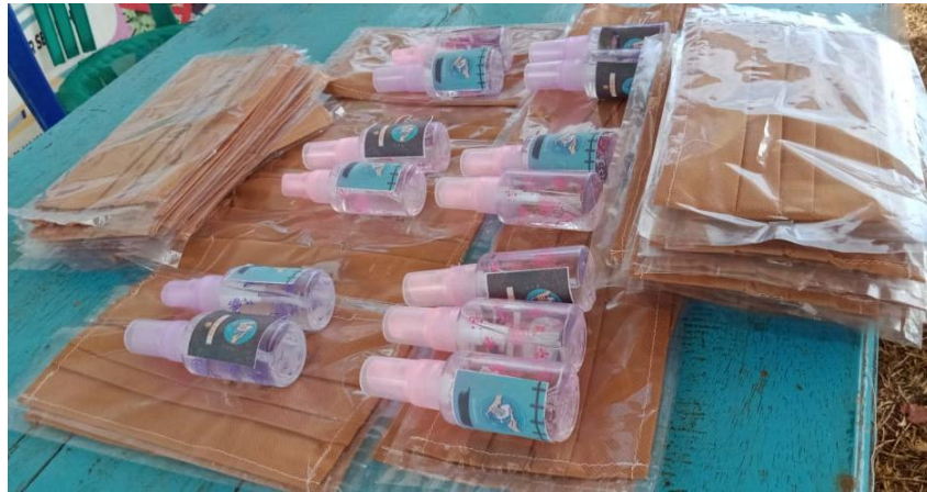
Gambar 3. Masker & Handsanitizer yang telah dibuat