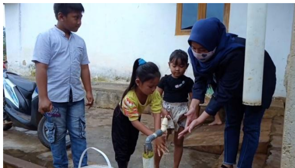
Gambar 8. Mengajarkan anak-anak cara mencuci tangan

Selain menggunakan sabun, pemakaian air bersih ketika membilas pun menjadi poin penting. Langkah mencuci tangan yang benar menurut WHO adalah dengan menuang cairan sabun pada telapak tangan kemudian usap dan gosok kedua telapak tangan secara lembut dengan arah memutar, usap dan gosok juga kedua punggung tangan secara bergantian, gosok sela-sela jari tangan hingga bersih, bersihkan ujung jari secara bergantian dengan posisi saling mengunci, gosok dan putar kedua ibu jari secara bergantian dan letakkan ujung jari ketelapak tangan kemudian gosok perlahan. Keringkan tangan dengan tissue atau diangin-anginkan.