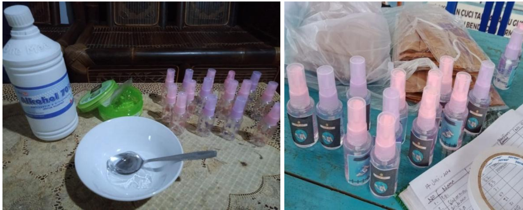
Gambar 2. Pembuatan Handsanitizer