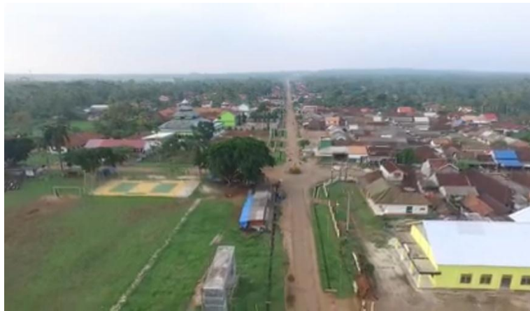
Gambar 2. Desa Sadar Sriwijaya