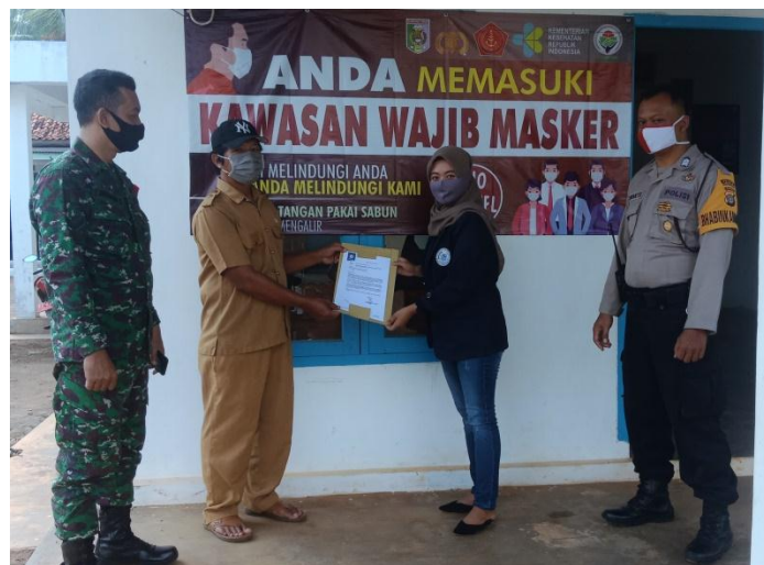
Gambar 1. Penyerahan Surat Tugas

Penyerahan surat tugas sebagai permohonan izin melaksanakan kegiatan PKPM yang di serahkan kepada Bapak Kepala Desa didampingi aparat keamanan desa setempat.