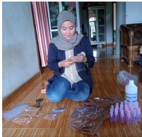
Gambar 2. Pembuatan Masker