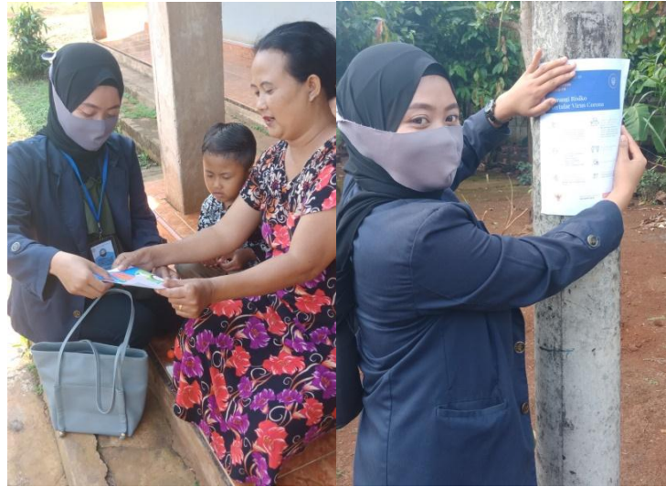
Gambar 7. Membagi dan menempel selebaran

menjaga diri dari bahaya virus corona. Pembagian selebaran berisi pengetahuan tentang apa itu virus corona, cara pencegahannya, dan cara cuci tangan yang benar. Dibagikan kepada masyarakat dan sebagian lagi ditempel di tempat-tempat umum seperti balai desa, sekolah, pohon-pohon, dan tiang listrik disepanjang jalan desa.