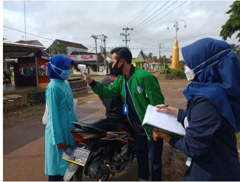
Gambar 4. Pengecekan Suhu Tubuh