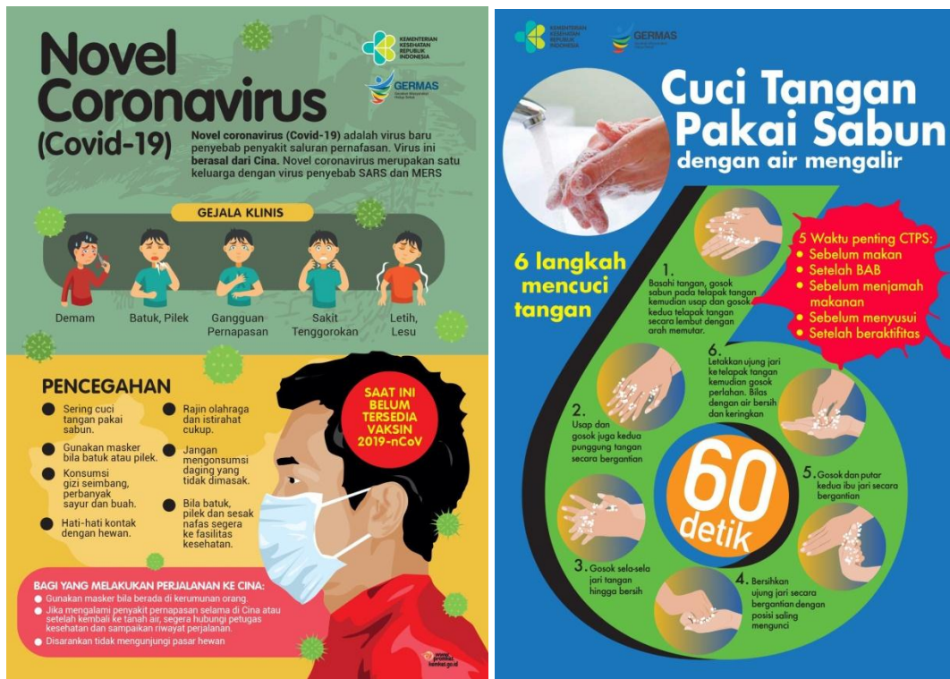
Gambar 5. Selebaran yang dibagikan kepada