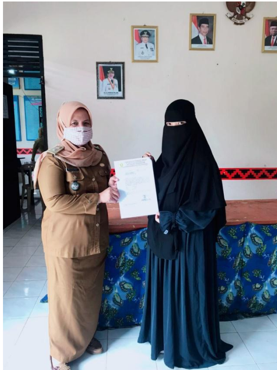
Gambar 2.1 pengambilan surat tanda terima

mengikuti protocol kesehatan sesuai dengan anjuran pemerintah. Dengan adanya penyuluhan mengenai masalah wabah covid-19.