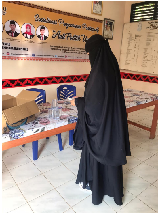
Gambar 2.6 kegiatan piket BAWASLU