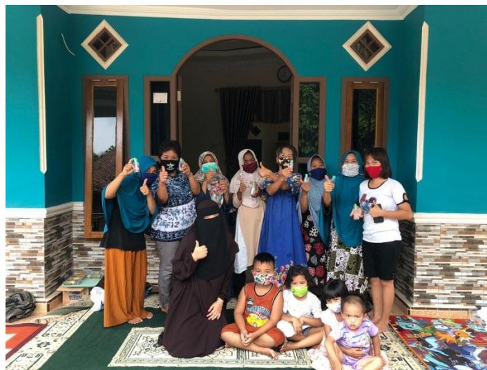
Gambar 2.5 pembagian handsanitizer