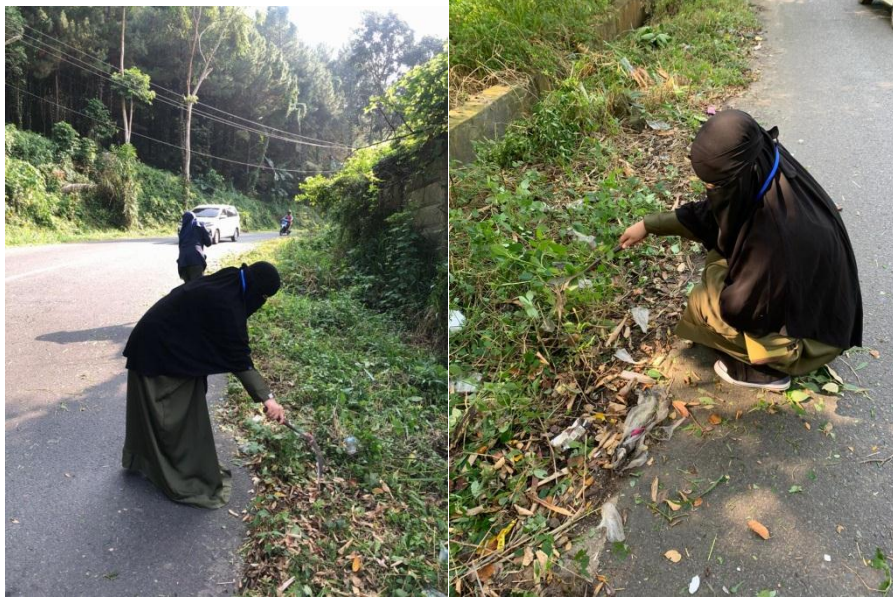
Gambar 2.6 kegiatan bersih-bersih lingkungan