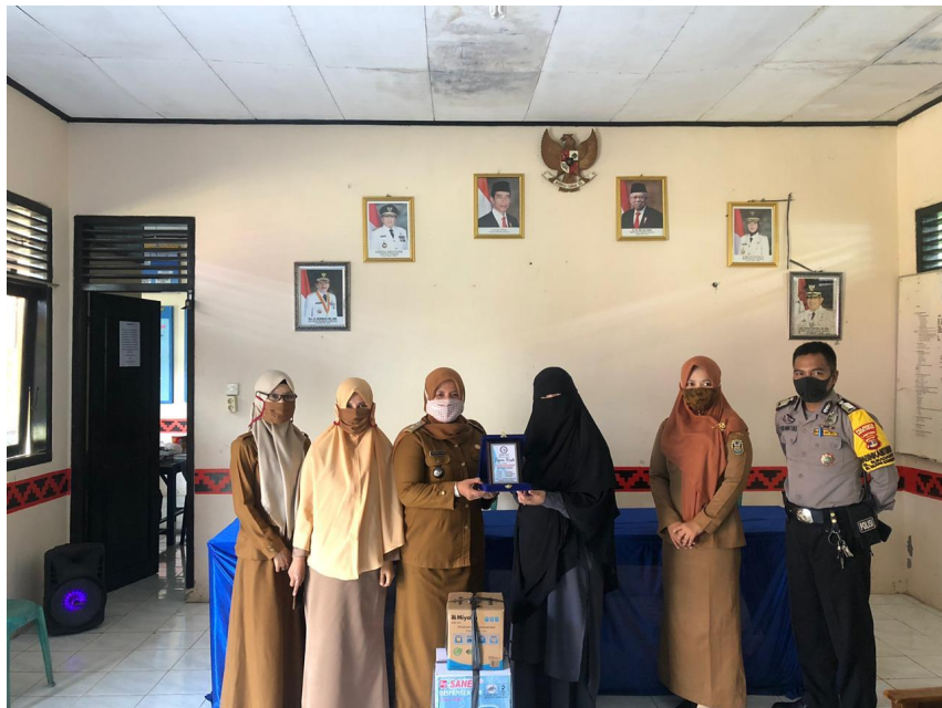
Gambar 2.7 kegiatan perpisahan dengan kelurahan