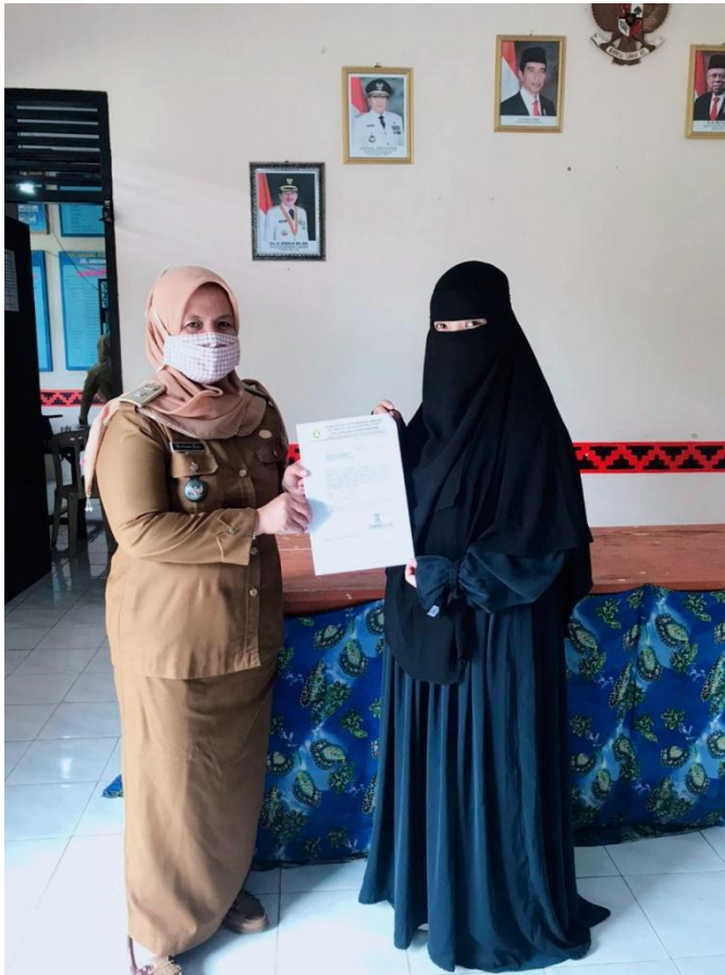
Lampiran II Mengedukasi pemahaman masyarakat tentang covid -19