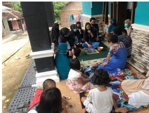
Gambar 2.4 pembuatan handsanitizer menggunakan bahan herbal