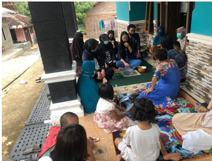
Gambar 2.2 penyuluhan mengenai wabah covid-19