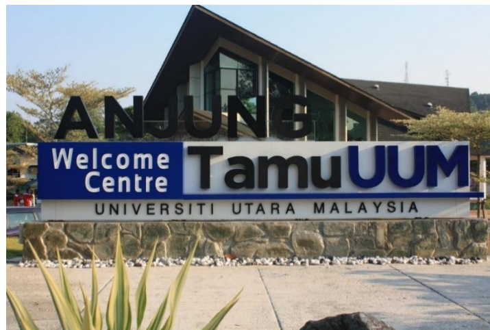
Gambar 2.1 Anjungan Tamu UUM