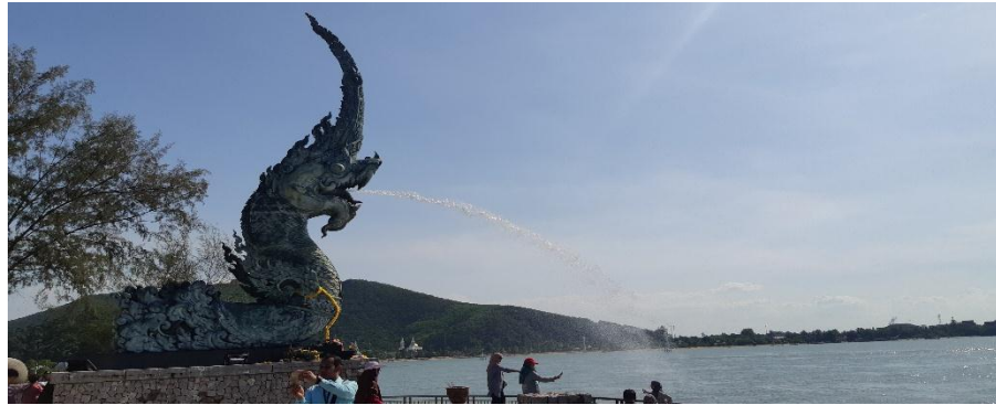
Gambar 2.7 Pantai Shongkhla