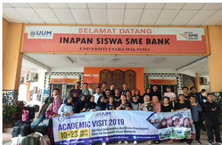
Gambar 2.3. Inapan SME BANK