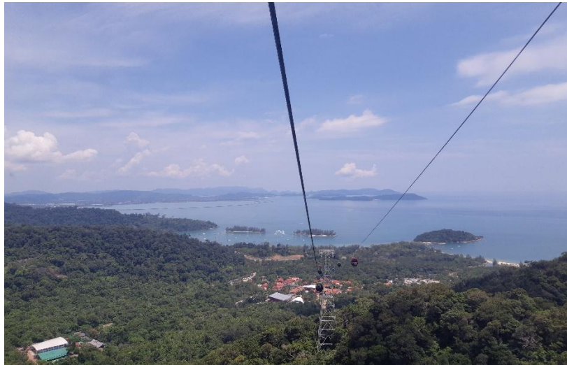
Gambar 2.4 Cable Car

ini sangat luar biasa ramai karna memiliki peamandagn yang sangat menarik, kita dapat