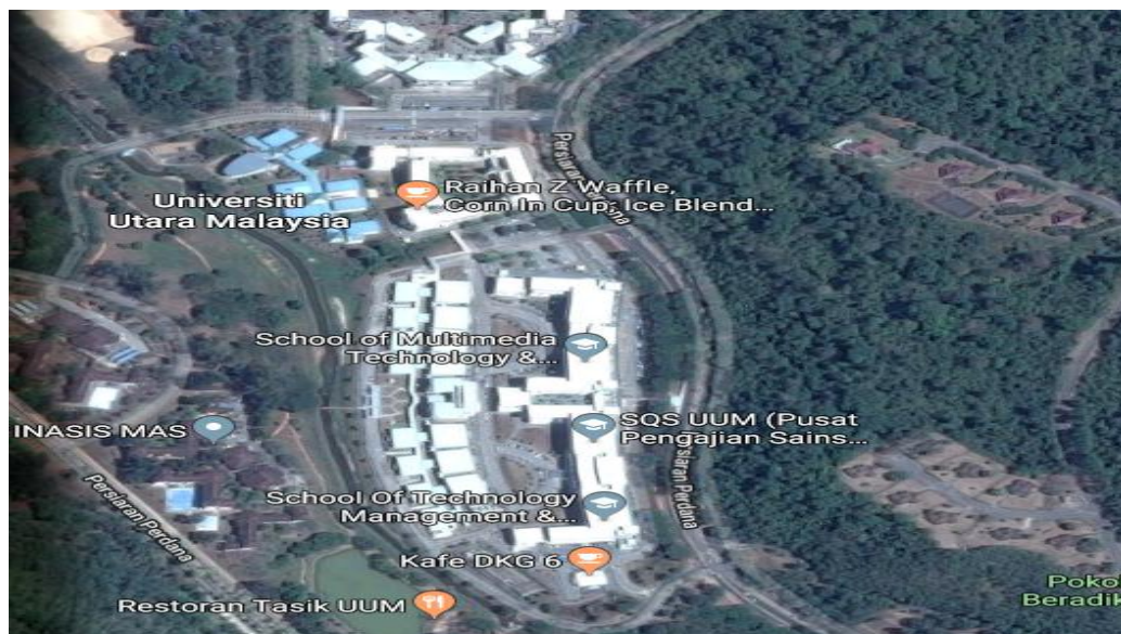
Gambar 2.2.1 Lokasi Universiti Utara Malaysia di 06010 Sintok, Kedah Darul Aman, Malaysia.