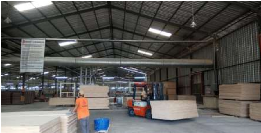
Proses pengemasan kayu