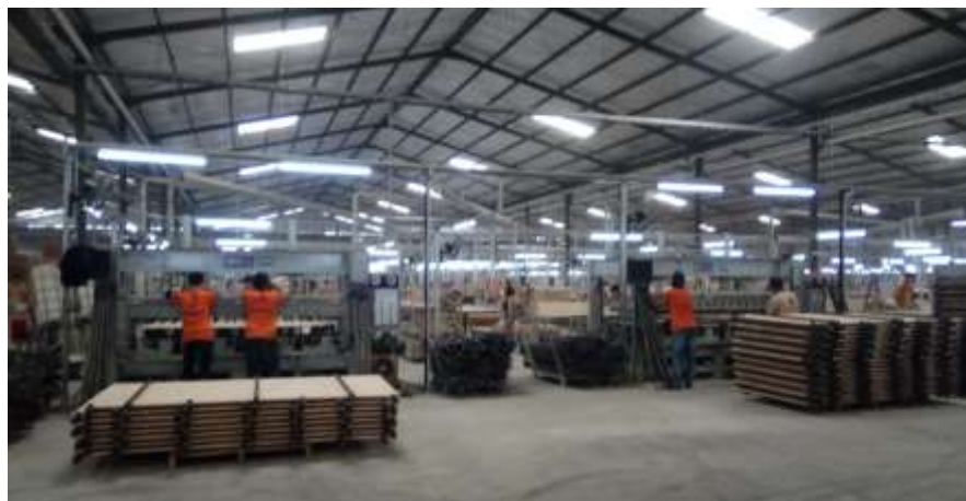
Proses pengumpulan kayu