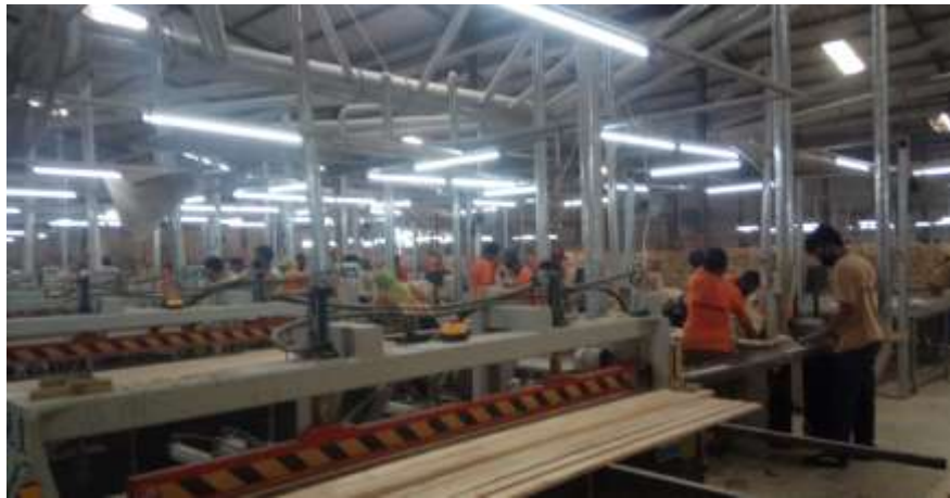
Proses penghalusan kayu