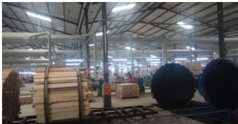
Proses cairan pengobatan kayu