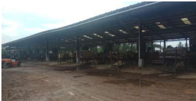
Proses pengolahan bahan mentah kayu