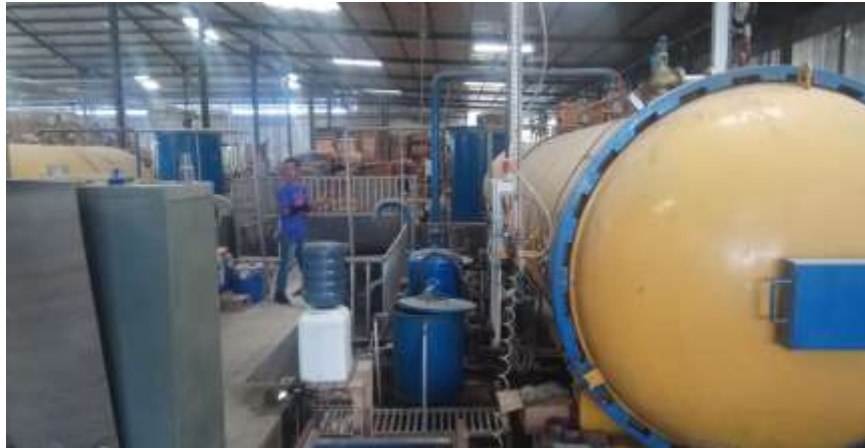
Proses pengeringan kayu