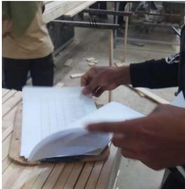
Proses absensi karyawan