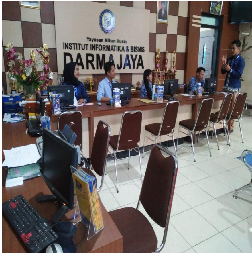
( Kegiatan Sosialisasi Kepada Tim Pemasaran )