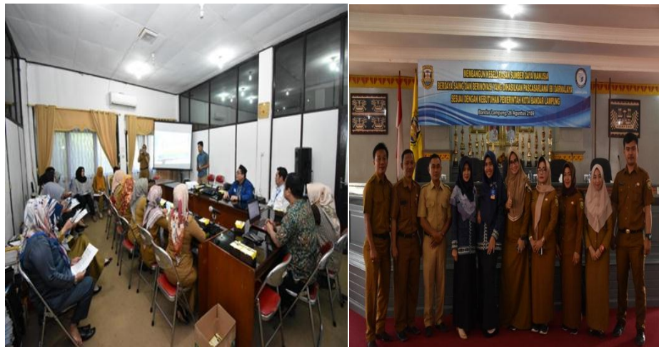
( Roadshow Dalam Pemasaran Konvensional )

yang bertujuan agar perusahaan dapat melihat seberapa besarkah peran digital marketing dalam memvisualisasikan pemasaran konvensional melalui media sosial, yang memiliki kesamaan fungsi yaitu penginformasian yang bertujuan memasarkan kampus IIB Darmajaya.