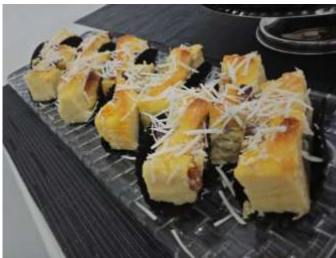
Gambar 2.2 : Produk Bread Pudding