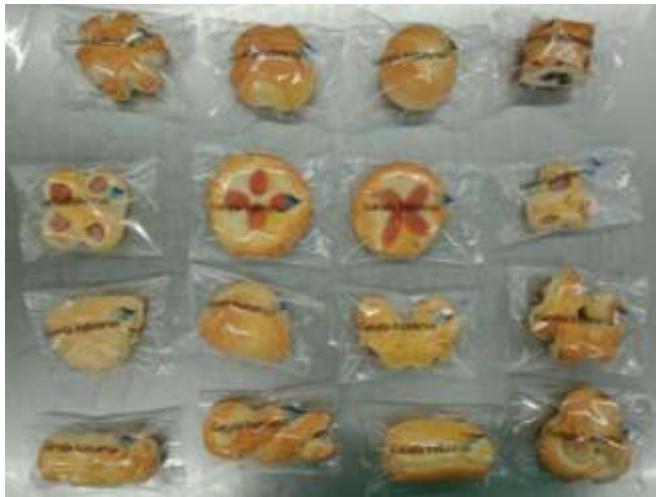
Gambar 2.1 : Aneka Roti Manis dan Asin

akan di update dengan melakukan meal persentasi setiap tahunnya. Aeronurti Nusa Mandiri dapat memproduksi Produk Pastry Bakery Sebanyak 1.000 pcs sampai dengan 1.500 pcs per hari khusus untuk penumpang ekonomi, dan memproduksi sebanyak 75 pcs per hari untuk penumpang bisnis. Jumlah tersebut disesuaikan dengan permintaan dari pelanggan