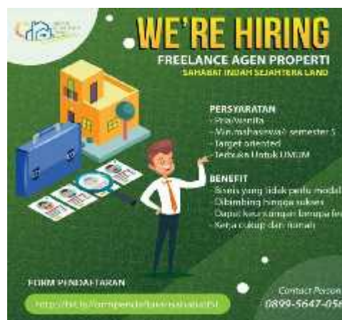
Gambar 1. Poster Pengumuman Lowongan Program sahabat Indah Sejahtera

Hasil dari program pertama, penulis mendapatkan Anggota Sahabat Indah Sejahtera dengan data diri sebagai berikut :