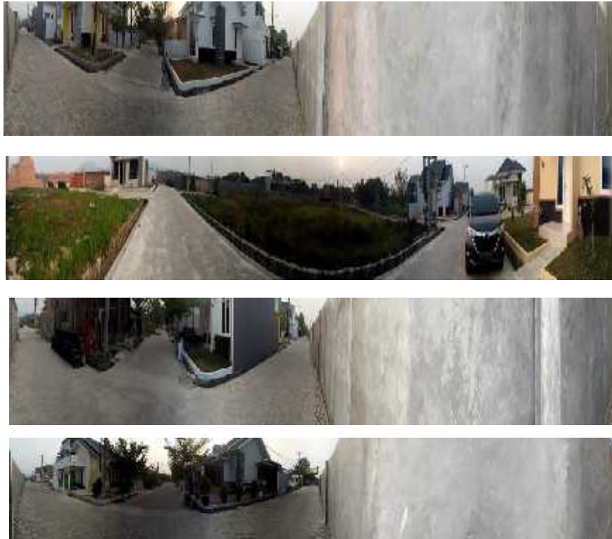
Gambar 6. Beberapa Hasil Foto 360 di Perumahan Indah Sejahtera Golf Residence