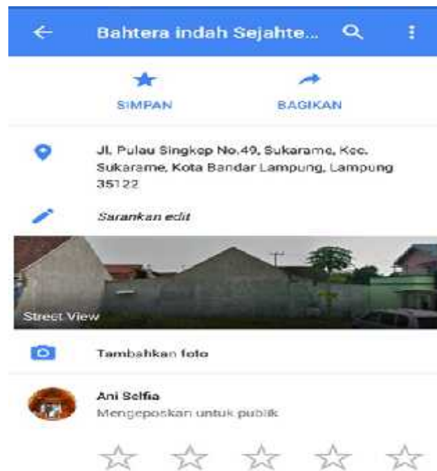
Gambar 5. Tampilan pada Google Maps setelah Penambahan Lokasi