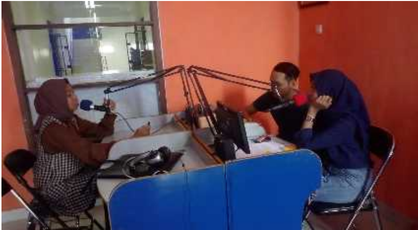
Gambar 3. Proses siaran di Radio Darmajaya

Bekerjasama dengan UKM DCFC. Dimana DCFC adalah UKM yang di naungi IBI Darmajaya yang memliki banyak sub sektor dan cocok untuk di ajak untuk bekerjasama.