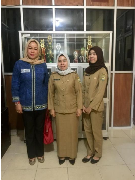
(1.4) Proses pengantaran oleh DPL