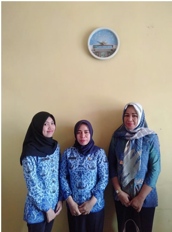
(1.5) Proses Penjemputan oleh DPL