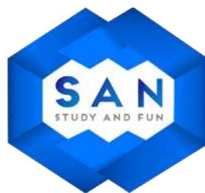
Gambar 2.1 Logo San Education Lampung

Di era modern seperti saat ini, lapangan kerja sangat terbatas untuk mereka yang memiliki tingkat pendidikan yang rendah. Penyedia lapangan kerja saat ini, memiliki standarisasi penerimaan pegawai dengan standar pendidikan yang tinggi. Jika di era 1990-an, masih sangat mudah menemukan lapangan kerja dengan spesifikasi pendidikan SMA atau bahkan SD, namun saat ini penerimaan pegawai umumnya mensyaratkan minimal lulusan D3 atau S1. Kondisi tersebut mendorong generasi muda, berlomba-lomba untuk menempuh pendidikan ke jenjang perguruan tinggi, setiap tahun ratusan ribu lulusan SMA bersaing untuk masuk perguruan tinggi baik negeri ataupun swasta. Oleh karena itu, diciptakan lah sebuah Perusahaan Startup berbasis teknologi yang diberi nama SAN EDUCATION pada tanggal 10 Februari 2018 untuk mendukung kemajuan edukasi yang ada di Indonesia khususnya Lampung.