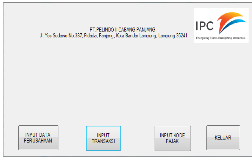
Gambar 4.1 Tampilan Home Program

Pada halaman ini karyawan akan di berikan beberapa pilihan yang terdiri dari pilihan inputan :