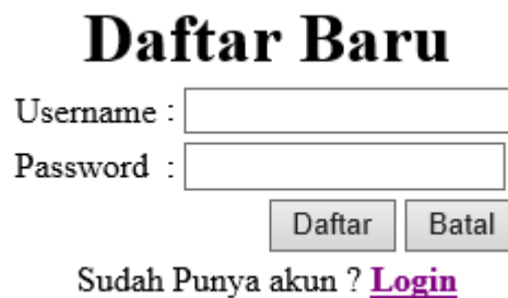
Gambar 4.4 Daftar

Gambar 4.4 Daftar calon pengguna harus mengisi Username dan password kemudian klik daftar untuk mempunyai akun. Username disini harus diisi dengan nomor pegawai masing-masing.