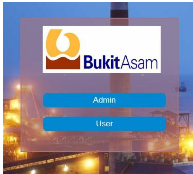
Gambar 4.1 Login

Gambar 4.1 Login memberikan 2 pilihan yaitu login sebagai admin atau login sebagai user .