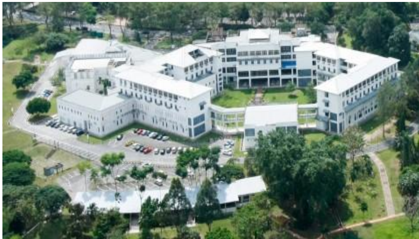
Gambar 2.4 Gedung Universitas Utara Malaysia, Sintok, Kedah (Sumber : https://campusupdate.id/internasional/universitas-utara-malaysia-uum-kampus-tengah-hutan-dengan-transportasi-memadai/ )

Kampus UUMKL adalah pusat studi UUM yang sepenuhnya dimiliki pertama di luar Sintok dan dioperasikan langsung oleh UUM. Ini adalah kampus non-perumahan yang menempati gedung sembilan lantai di pusat kota di sepanjang Jalan Raja Muda Abdul Aziz di daerah Kampung Baru dan berdekatan dengan Chow Kit.