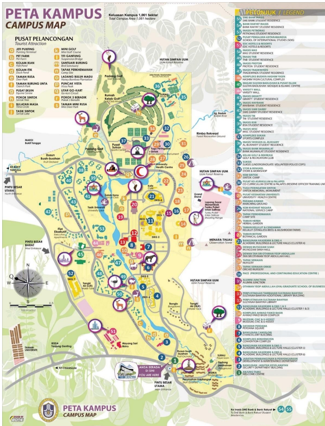
Gambar 2.6 Denah University Utara Malaysia