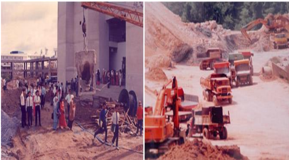
Gambar 2.2 Pembangunan Setelah Empat Bulan Pembukaan Resmi Kantor UUM

Sementara itu, perencanaan kampus permanen telah dimulai. Itu akan dibangun di atas lahan seluas 1.061 hektar di Sintok (di distrik Kubang Pasu), 48 km utara Alor Setar dan 10 km timur Changlun, sebuah kota kecil di sepanjang Jalan Raya Utara-Selatan, dekat Malaysia-Thailand berbatasan.