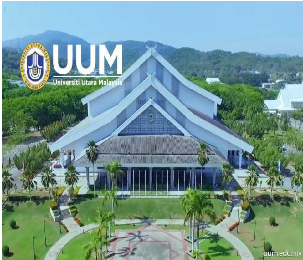
Gambar 2.3 Universitas Utara Malaysia, Sintok, Kedah

Karena luasnya lahan, universitas telah menggunakan 107 hektar hutan untuk mengembangkan fasilitas yang terbuka untuk digunakan oleh orang luar. Dengan demikian kampus telah berkembang menjadi kampus terbuka tempat orang luar dan wisatawan berkunjung. Di antara fasilitasnya adalah area piknik, lapangan golf sembilan lubang, sirkuit go-kart, lapangan tembak dan memanah, dan situs berkuda.