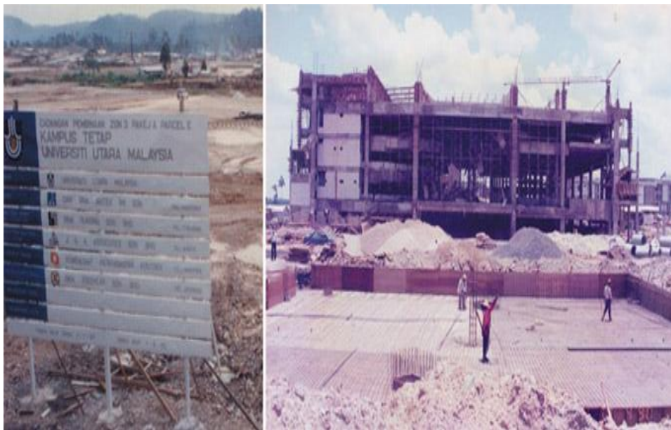
Gambar 2.1 Pembangunan Universitas Utara Malaysia Pertama kali pada 16 Februari 1984