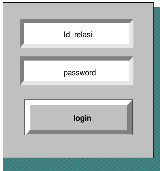
Gambar 4.2.5 Rancangan Tampilan Login