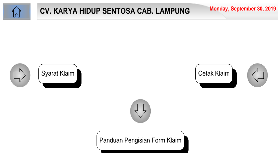
Gambar 4.2.1 Rancangan Tampilan Browser