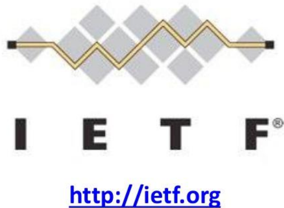
Gambar 3.2.3 Sit in Class IETS