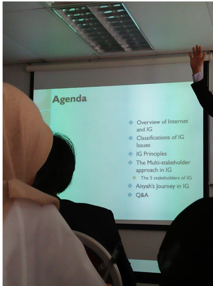
Gambar 3.2.3 Sit in Class Agenda