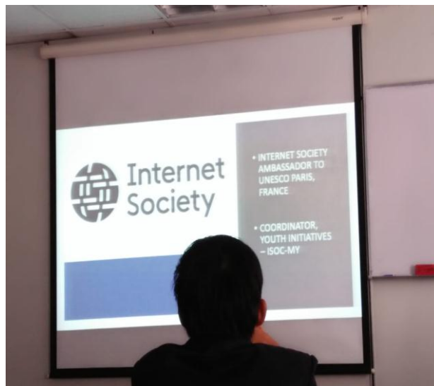
Gambar 3.2.1 Sit in Class Internet Society

Internet adalah kumpulan jaringan yang saling berhubungan yang otonom dan mengimplementasikan protokol terbuka dan standar. Tidak ada orang, pemerintah, atau entitas memiliki atau mengendalikan Internet. Sebaliknya, sebuah organisasi relawan yang disebut ISOC (Internet Society) mengontrol masa depan Internet. Ini menunjuk sebuah kelompok penasehat teknis disebut IAB (Internet Architecture Board) untuk mengevaluasi dan menetapkan standar.