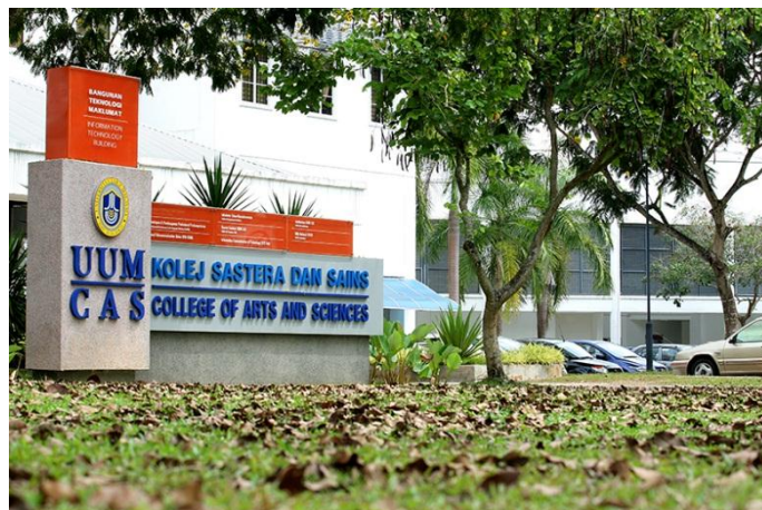
Gambar 2.4 Tempat Pelaksanaan Academi Visit

Tempat dilaksanakannya Academic Visit dimana ada Struktur Organisasi UUM