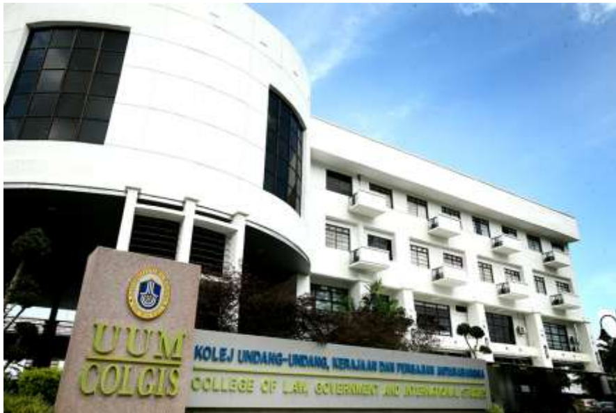
Gambar 2.4 Tempat Pelaksanaan Academi Visit

Tempat dilaksanakannya Academic Visit dimana ada Struktur Organisasi UUM