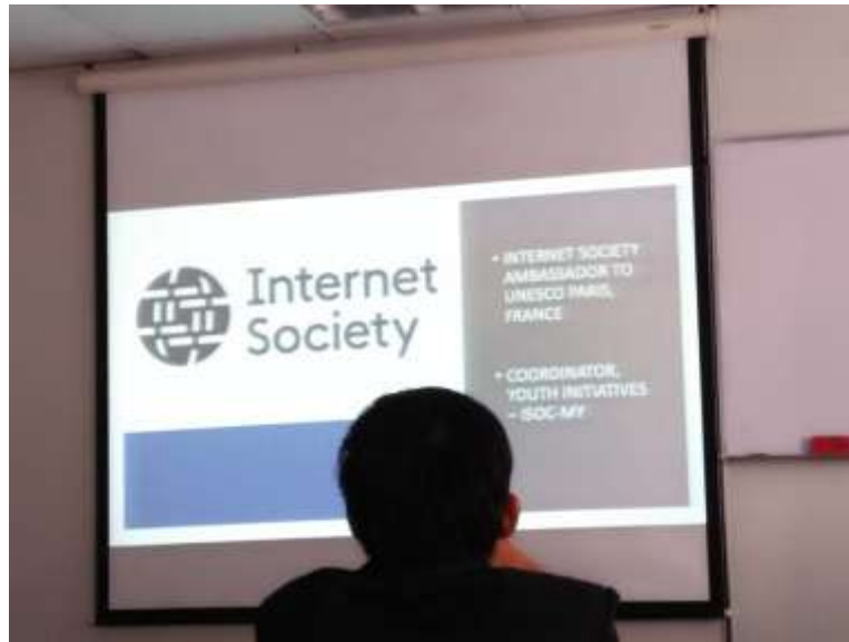
Gambar 3.2.1 Sit in Class Internet Society

penasehat teknis disebut IAB (Internet Architecture Board) untuk mengevaluasi dan menetapkan standar.