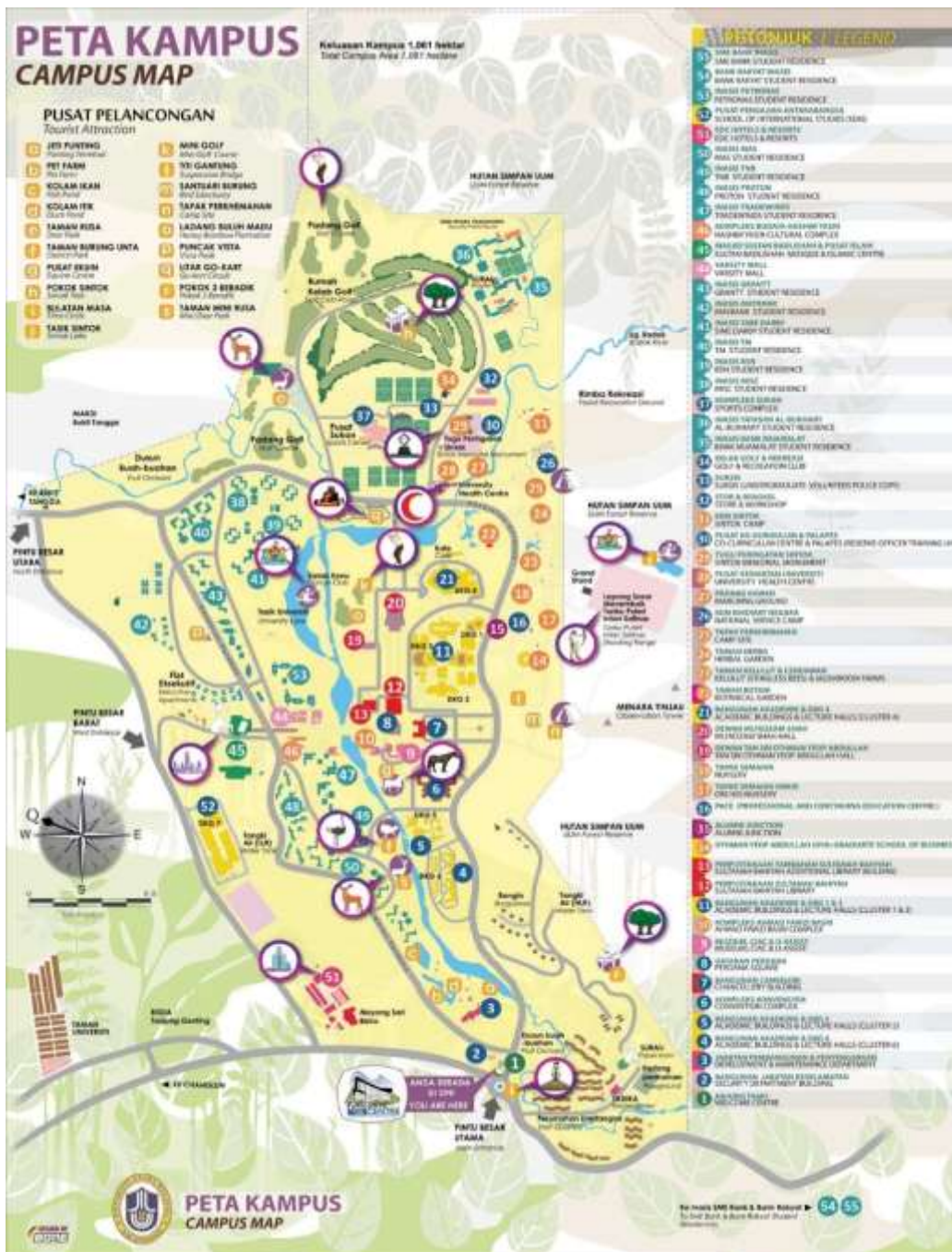
Gambar 2.6 Denah University Utara Malaysia