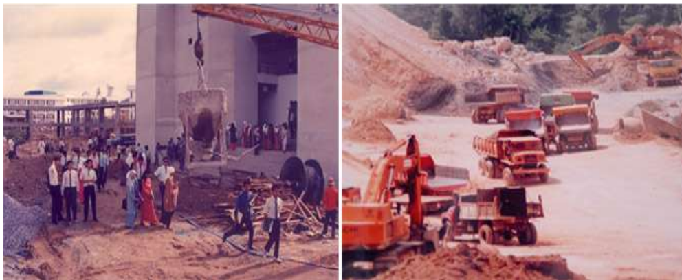
Gambar 2.2 Pembangunan Setelah Empat Bulan Pembukaan Resmi Kantor UUM

Sementara itu, perencanaan kampus permanen telah dimulai. Itu akan dibangun di atas lahan seluas 1.061 hektar di Sintok (di distrik Kubang Pasu), 48 km utara Alor Setar dan 10 km timur Changlun, sebuah kota kecil di sepanjang Jalan Raya Utara-Selatan, dekat Malaysia-Thailand berbatasan.