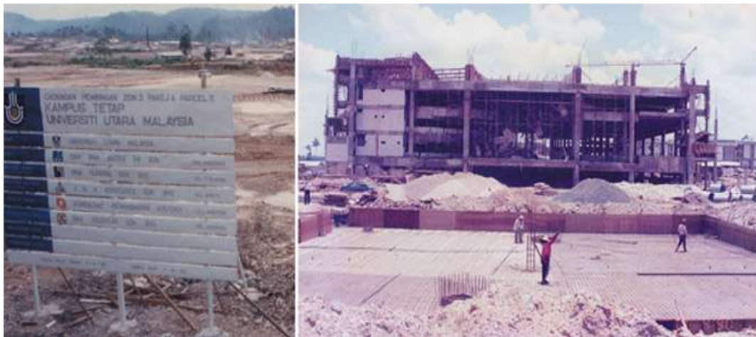
Gambar 2.1 Pembangunan Universitas Utara Malaysia Pertama kali pada 16 Februari 1984