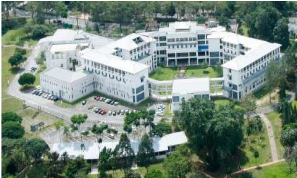
Gambar 2.4 Gedung Universitas Utara Malaysia, Sintok, Kedah