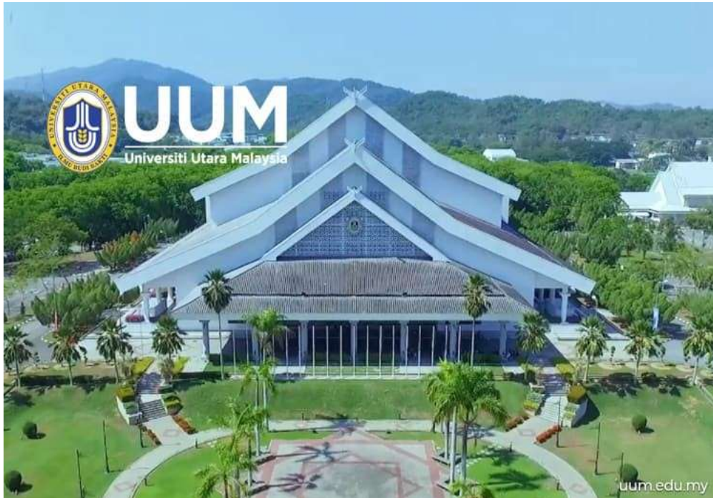
Gambar 2.3 Universitas Utara Malaysia, Sintok, Kedah

Karena luasnya lahan, universitas telah menggunakan 107 hektar hutan untuk mengembangkan fasilitas yang terbuka untuk digunakan oleh orang luar. Dengan demikian kampus telah berkembang menjadi kampus terbuka tempat orang luar dan wisatawan berkunjung. Di antara fasilitasnya adalah area piknik, lapangan golf sembilan lubang, sirkuit go-kart, lapangan tembak dan memanah, dan situs berkuda.