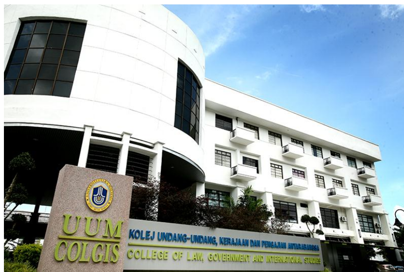
Gambar 2.4 Tempat Pelaksanaan Academi Visit

Tempat dilaksanakannya Academic Visit dimana ada Struktur Organisasi UUM