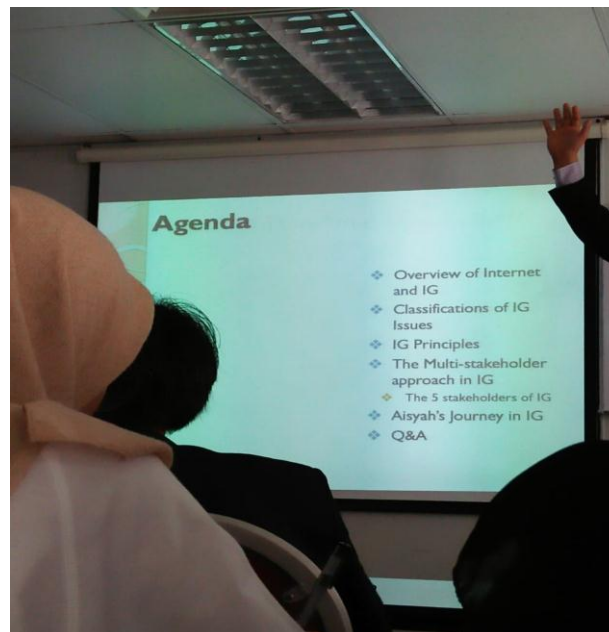
Gambar 3.2.3 Sit in Class Agenda

Agenda adalah suatu hal yang penting dalam internet , classflat form , the multi stakeholder . dibawah ini adalah foto saat sit in class berlangsung yaitu suatu agenda yang harus kami lakukan saat kami menjalani academic visit di university utara Malaysia.