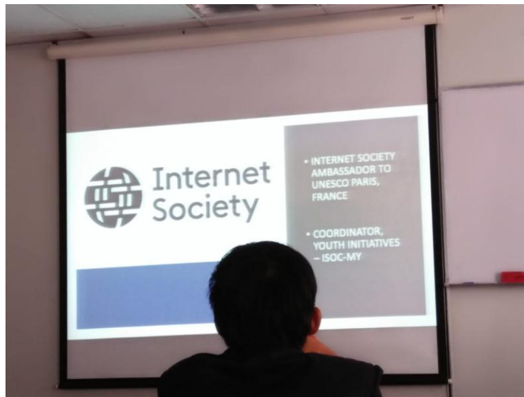
Gambar 3.2.1 Sit in Class Internet Society

menunjuk sebuah kelompok penasehat teknis disebut IAB (Internet Architecture Board) untuk mengevaluasi dan menetapkan standar.