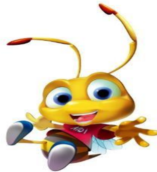
Gambar 2.2 Maskot Alfamart

Jenis tulisan Alfamart melambangkan pelayanan yang profesional didukung kepedulian yang tulus, sedangkan strip merah kuning dibawahnya melambangkan fondasi yang kuat dan cerdas, sekaligus dinamis. Arti dari sistem bendera yaitu Alfamart ingin menancapkan bendera Alfamart di hati setiap keluarga di seluruh Indonesia, dan menancapkan bendera Indonesia sampai ke negara lainnya.