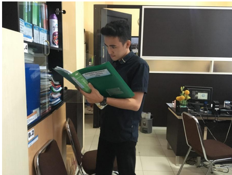
(pengecekan laporan kerjasama)