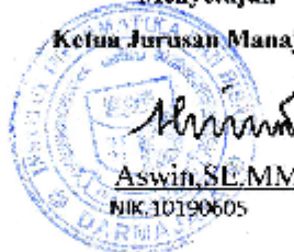
Aswin, SE, MM NIK. 10190605