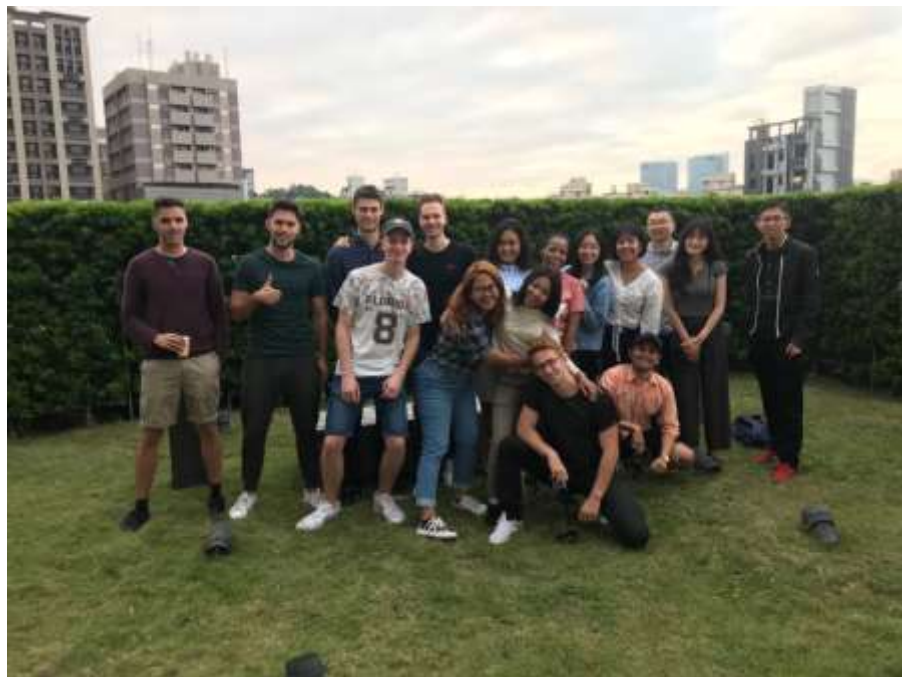
Gambar 1. 5 Foto Bersama Mahasiswa Penerima Beasiswa S2

Beasiswa yang diadakan untuk S1 dan S2. Program ini bertujuan untuk memberikan beasiswa kepada mereka yang berminat untuk melanjutkan pendidikan S1 maupun S2. Mahasiswa yang diterima dalam program ini diharuskan untuk mengikuti semua program internasional yang dinaungi oleh International Affairs. Untuk mendapatkan beasiswa ini calon mahasiswa harus mengikuti serangkaian test masuk. Calon mahasiswa juga harus memiliki skor TOEFL dan IELTS . Masing – masing skor untuk TOEFL dan IELTS adalah 577 dan 6,5. Calon mahasiswa juga harus memberikan surat sehat resmi dari rumah sakit ( medical checkup ). Untuk mahasiswa S1 dan S2 yang di terima akan diberikan 10.000NT/bulan atau sekitar Rp. 5.000.000 dan dibebaskan biaya kuliah selama berkuliah di Universitas Shih Chien. Namun, tetap membayar biaya asrama.