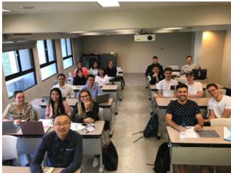
Gambar 1. 1 Proses Belajar Mengajar Dikelas

Program pertukaran mahasiswa ini memberikan kesempatan belajar baik yang keluar maupun masuk jangka pendek / non-gelar. Siswa dapat belajar dan membenamkan diri sebagai siswa formal selama satu semester atau satu tahun akademik. Kredit yang diperoleh diakui kedua universitas. Mereka yang ingin berpartisipasi dalam Program Pertukaran harus melalui Proses Penyaringan Internal. Kemudian, siswa harus menyerahkan materi aplikasi untuk penyaringan lebih lanjut.