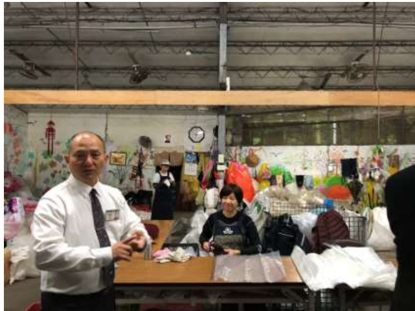
Gambar 1. 2 Kunjungan ke Tzu Chi Foundation

Company Visits merupakan program yang diadakan oleh ETP in International Business. Program ini bertujuan untuk mengetahui tentang perusahaan yang bekerjasama dengan Universitas Shih Chien. Seperti Tzu Chi Foundation dan China Airlines . Program ini bertujuan untuk mengetahui strategi yang di gunakan dalam perusahaan, mengetahui desain yang dipakai untuk seragam para karyawan, mengetahui tentang kegiatan apa saja yang di lakukan dalam perusahaan tersebut. Company visits juga ditujukan untuk ETP in Accounting namun, untuk mahasiswa akuntansi mengunjungi perusahaan secara terpisah dengan mahasiswa International Business dan Fashion Design.