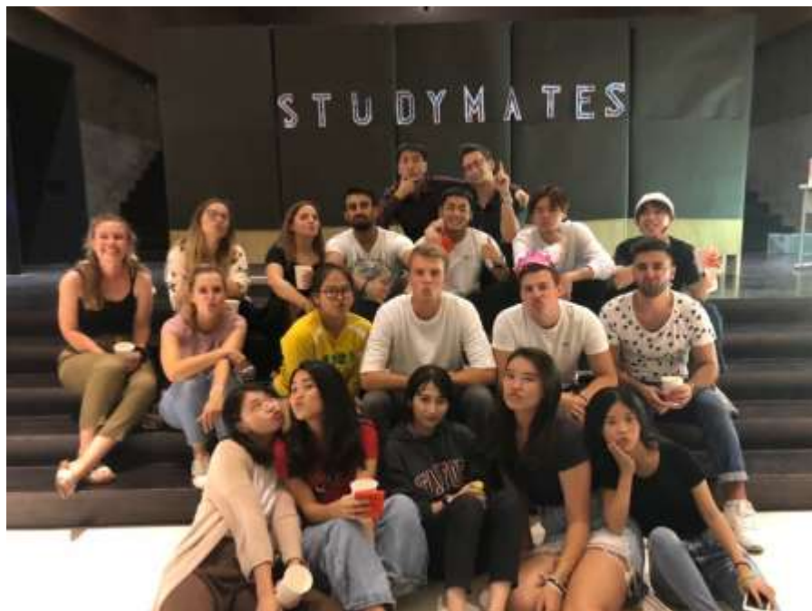
Gambar 1. 4 Study Mates, Pesta Selamat Datang

Program ini juga bisa disebut sebagai ekstrakurikuler yang ada didalam Universitas Shih Chien. Program ini merupakan tempat perkumpulan untuk para mahasiswa internasional. International Association ini dalah wadah untuk para mahasiswa international yang ingin bertukar informasi tentang Negara – Negara tetangga. Program ini juga banyak mengadakan kegiatan kegiatan. Seperti; International music night, international chef, culture exchange, food festival yang diadakan setelah internstional chef, Language Exchange dan masih banyak lagi. Club ini di dominasi oleh mahasiswa S1. Tidak hanya di kampus namun, mereka juga sering membuat pesta atau sekedar berkumpul dilantai 6 asrama atau didepan asrama.