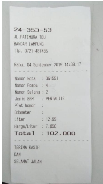
(Lampiran 1. Bukti Pengeluaran Kas Kecil)