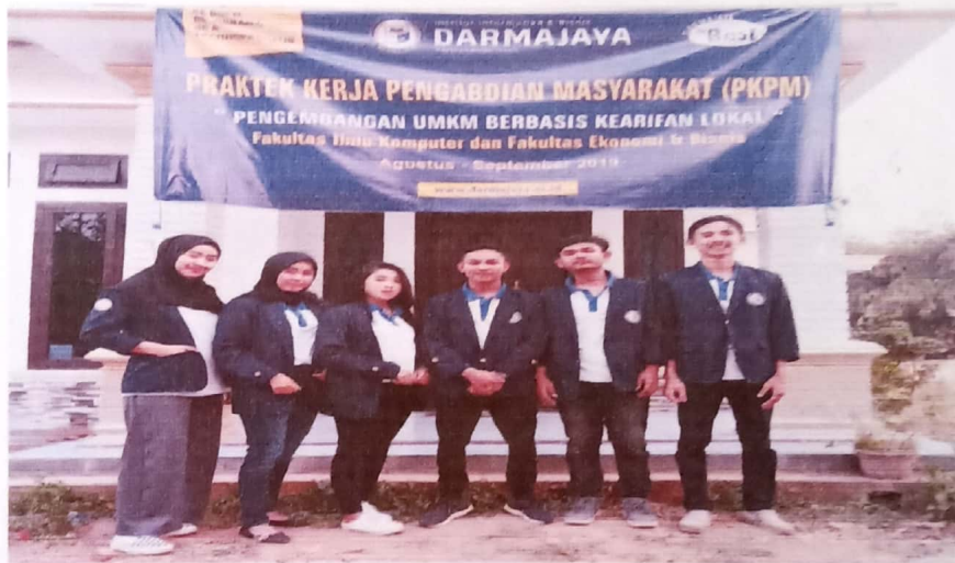
3) Foto Bersama dengan Pihak UKM