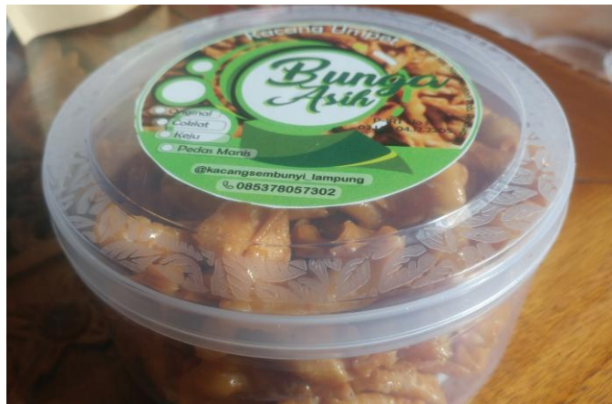
Desain kemasan hasil inovasi

Salah satu hasil kegiatan PKPM terkait lebel dan kemasan adalah membuat inovasi kemasan baru bagi produk UMKM. yang diharapkan dapat lebih menambah nilai jual pada produk tersebut.