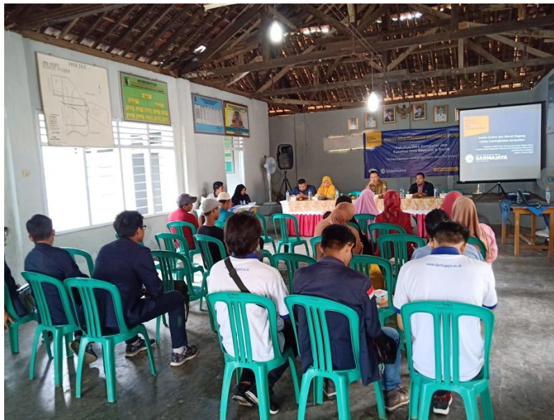
Foto pada saat pelatihan dibalai desa

Setelah diadakannya pelatihan umkm didesa kalirejo ini bertujuan untuk mempermudah dan memberikan wawasan aparat Kampung dalam memperoleh informasi mengenai potensi-potensi umkm penduduk desa kalirejo, seperti mengambil data mengenai hasil umkm, kegiatan produksi umkm, pemasaran hasil umkm di desa kalirejo ini yang berguna untuk mengenalkan beberapa potensi desa kalirejo serta dengan adanya kegiatan pelatihan tersebut dapat menjadikan wadah tentang informasi apapun yang terjadi di desa kalirejo melalui media sosial instagram umkm_kalirejo yang dapat di akses secara online dimanapun dan kapanpun.