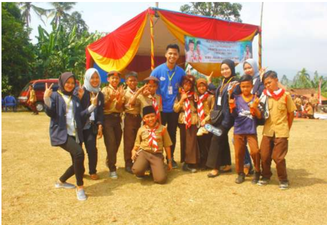
Gambar 2.1 Kegiatan Hari Pramuka Bersama Bapak Camat Way Ratai