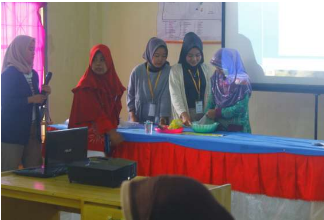
Gambar 2.3 Pembuatan Produk Inovasi Bobokong Bersama Ibu-Ibu Pkk