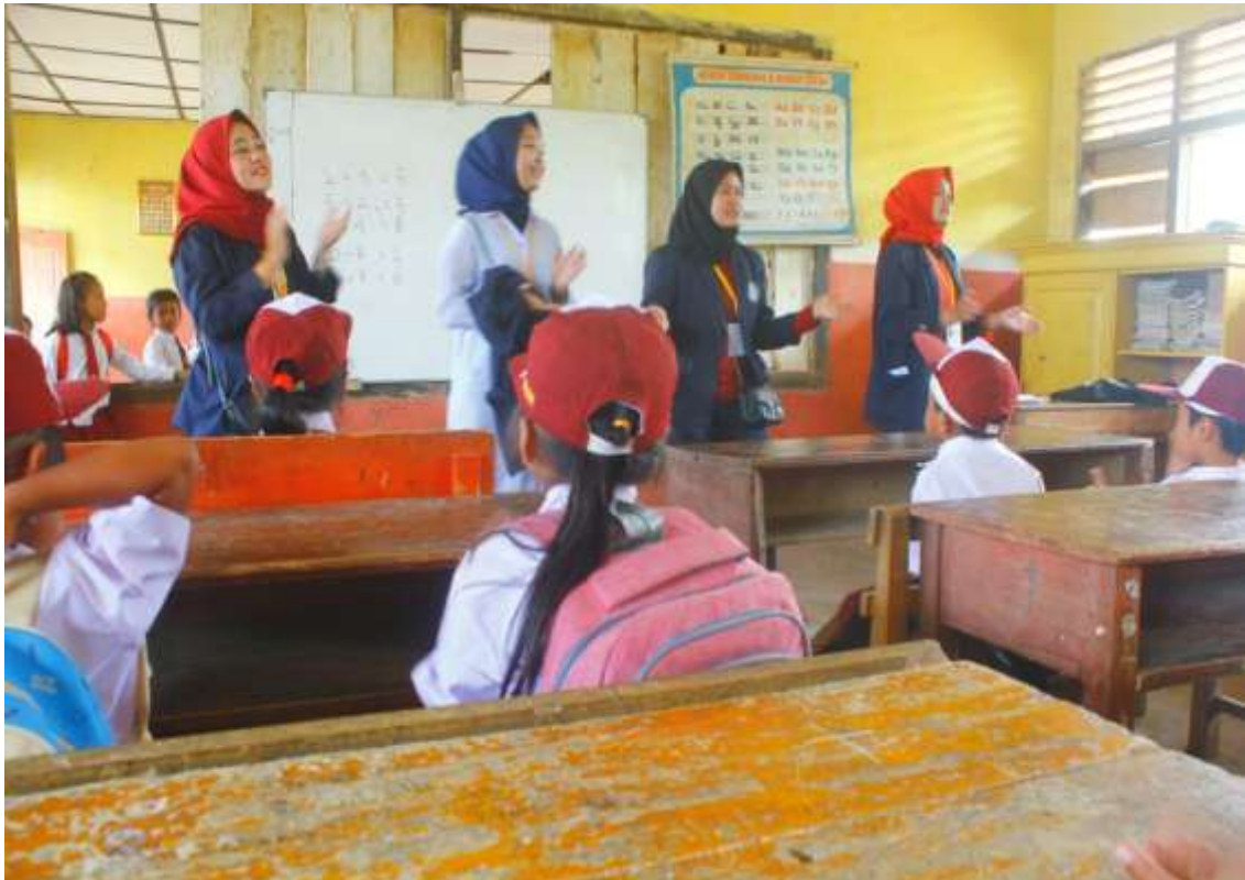
Gambar 2.2 Pelatihan Di SD N 4 Way Ratai