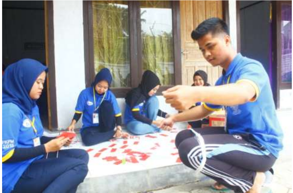
Gambar.3.10 Pemasangan Bendera