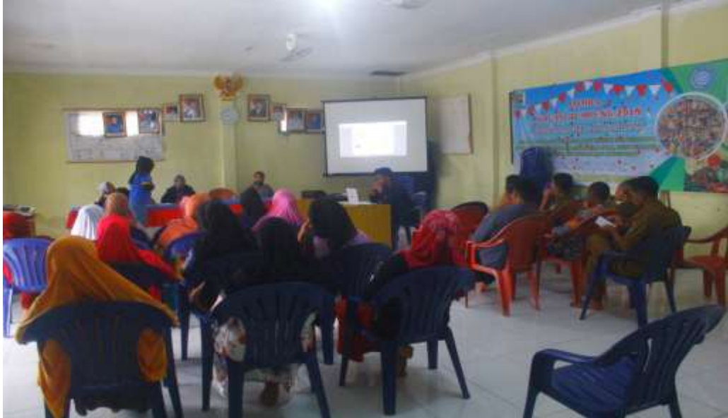
Gambar 3.8 Seminar SATGAS Waspada Investasi Syariah