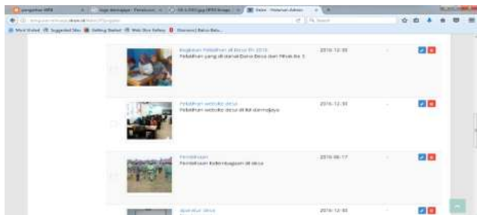
Gambar 3.6 Halaman Admin Web Desa Pesawaran Indah