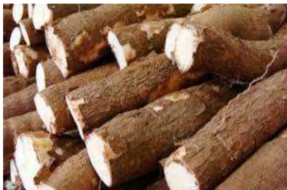
Gambar 3.1 Singkong Sebagai Bahan Dasar Bobokong

Bahan baku yang paling banyak dan mudah di dapatkan yaitu padi, coklat, dan buah pala ,sementara UKM yang berjalan aktif di Desa Pesawaran Indah ada UKM Sale dan Upik – upik . Kami memutuskan untuk mengambil singkong sebagai bahan produk inovasi kami yaitu Bobokong (bola-bola singkong). di Desa Pesawaran Indah memiliki banyak tanaman singkong dan kami mendapatkan singkong untuk membuat produk singkong tersebut. untuk membuat bobokong ( Bola – bola singkong ) kami sementara membeli di warung karena harga nya sama saja seperti di pasar setempat.