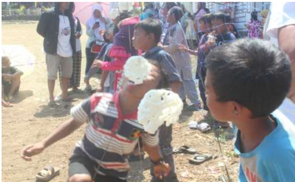
Gambar. 3.9 Lomba Makan Kerupuk