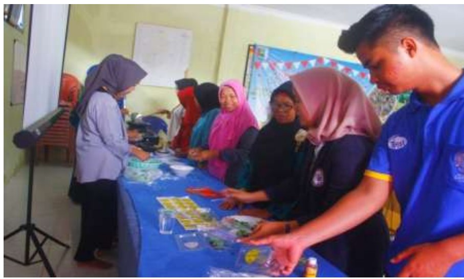
Gambar 3.2 Demonstrasi Inovasi Produk kepada Ibu-Ibu PKK