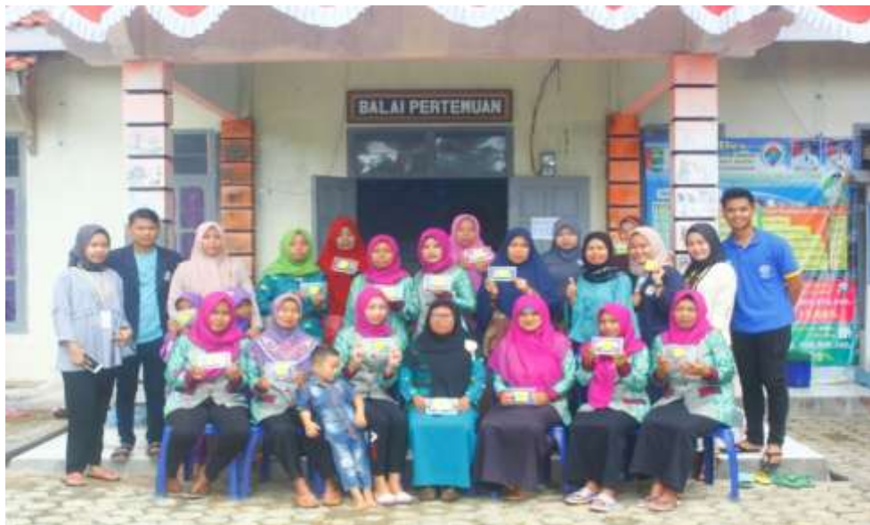
Gambar 3.3 Pembuatan Bobokong Bersama Ibu-Ibu Pkk