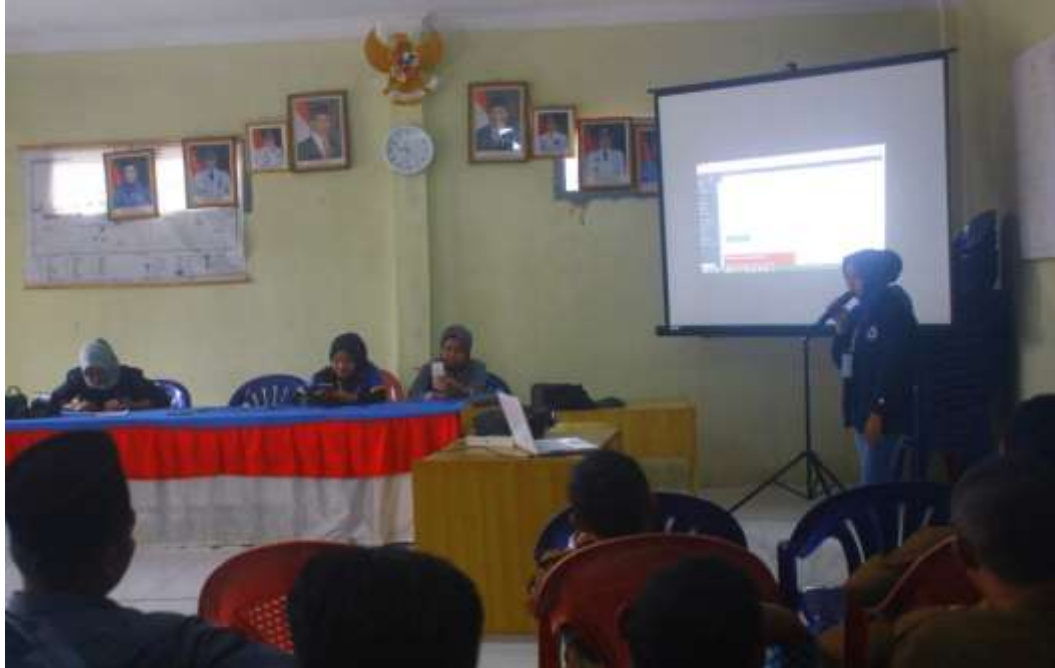
Gambar 3.7 Sosialisasi Web Desa