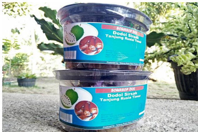
Gambar 18. Hasil kemasan dodol sirsak yang sudah diberi inovasi