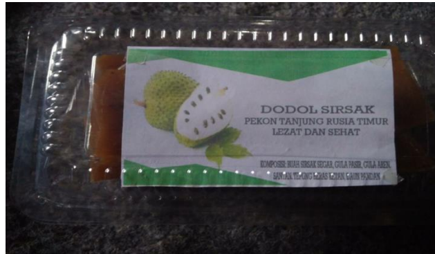
Gambar 17. Kemasan dodol sirsak sebelum diberi inovasi