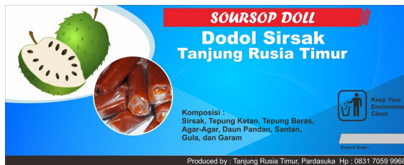
Gambar 13. Hasil dodol sirsak Tanjung Rusia Timur

UKM dodol sirsak yang berada di Desa Tanjung Rusia Timur belum memiliki merk dagang dengan diberikannya merk dagang harapannya agar hasil penjualan dapat lebih meningkat, dengan merk tersebut masyarakat mudah mengingatnya dan mudah untuk dihubungi apabila ingin memesan dodol sirsak dalam jumlah sedikit ataupun dalam jumlah banyak.