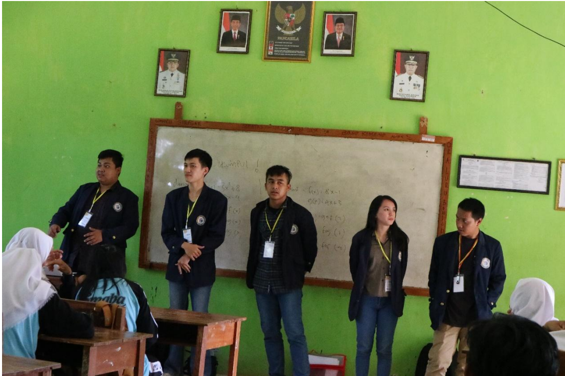
Foto Kegiatan Sosialisasi Internet Positif