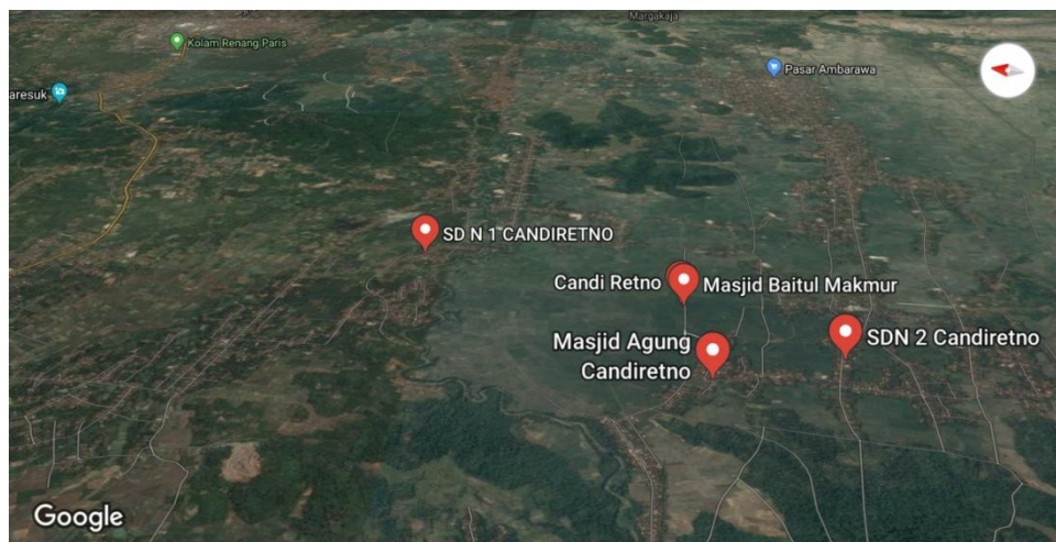
Gambar 2.1 Peta Wilayah Pekon Candiretno

Pekon Candiretnomemiliki luas wilayah 437,39 hektar. Jarak tempuh ke ibu kota Pemerintahan Kecamatan adalah 6 Km dan jarak tempuh ke ibu kota Pemerintahan Kabupaten adalah 45 km.