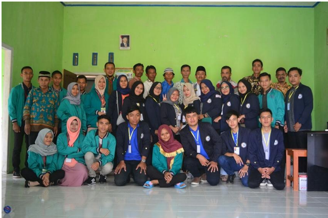
Foto bersama Aparatur Pekon Candiretno dengan Mahasiswa IIB Darmajaya, Mahasiswa STIE dan STIS Pringsewu