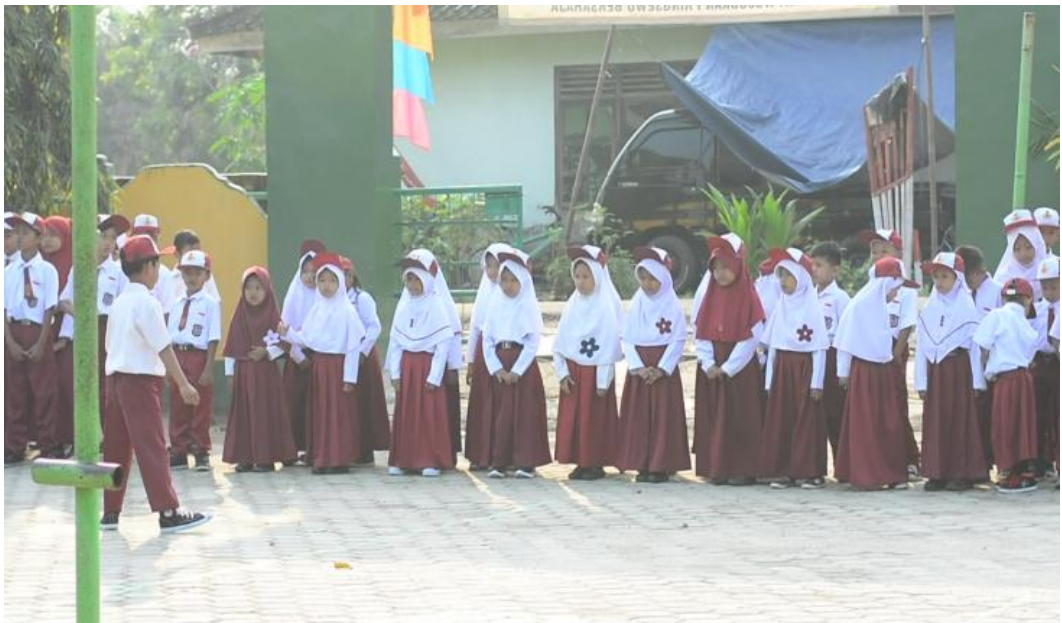
Kunjungan ke SD N 1 Pekon Candiretno