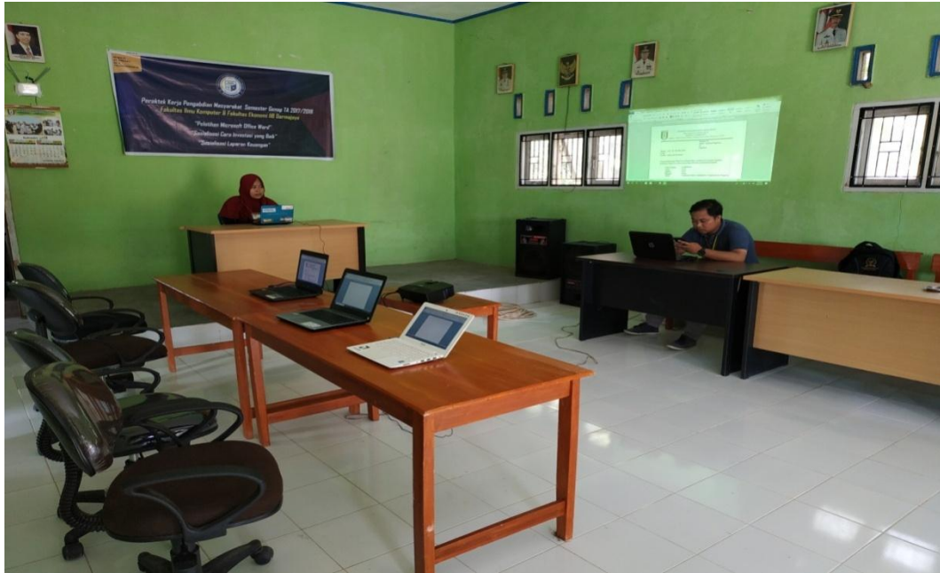
Persiapan pelatihan komputer untuk Aparatur Pekon Candiretno