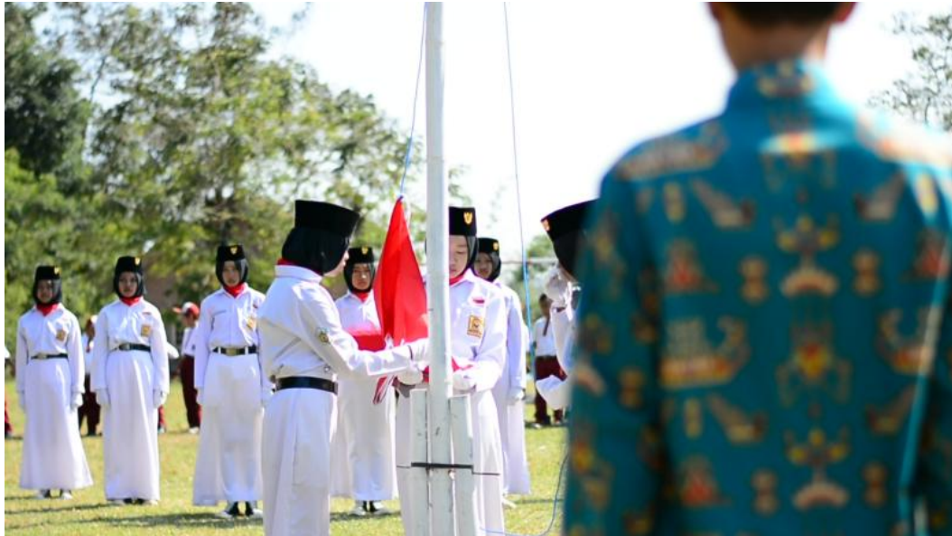
Upacara 17 Agustus 2018 di Lapangan Pekon Candiretno