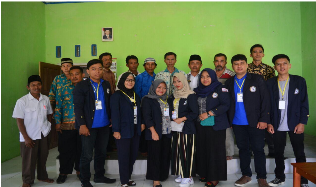
Foto bersama Aparatur Pekon Candiretno