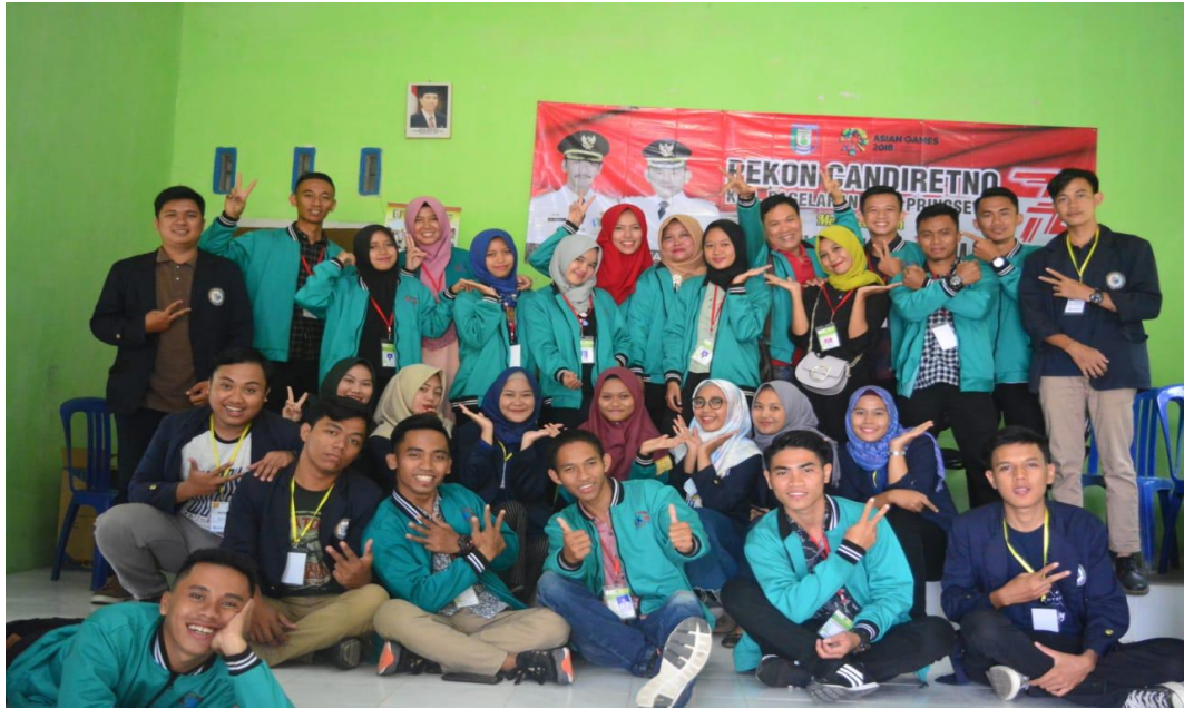
Foto bersama Mahasiswa IIB Darmajaya dengan Mahasiswa STIE dan STIS Pringsewu