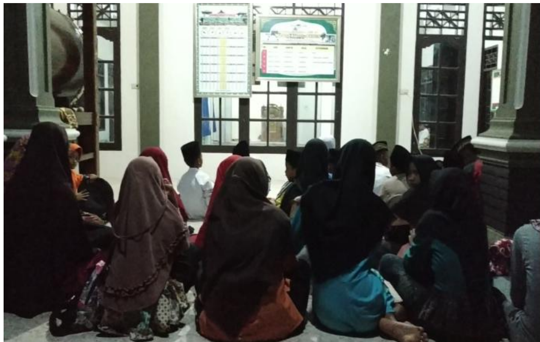
Pengajian di Masjid Pekon Candiretno Dusun Kuto Pengasih