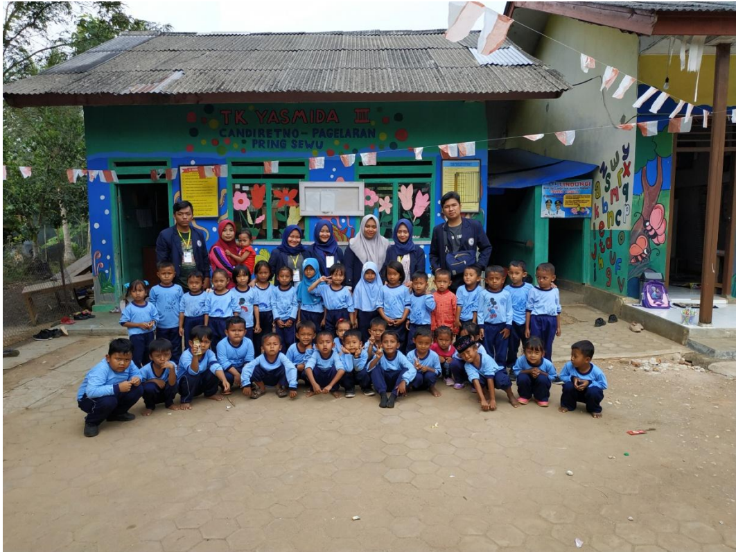
Foto bersama setelah sosialisasi tentang hidup sehat di TK Yasmida Pekon Candiretno