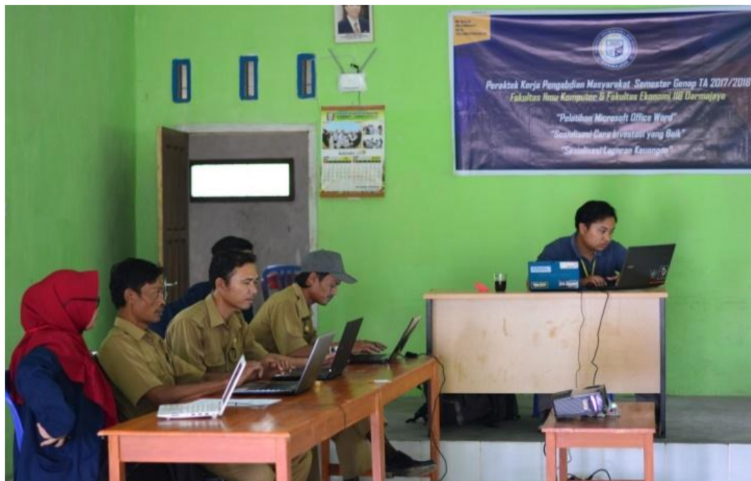
Pelatihan komputer bersama Aparatur Pekon Candiretno