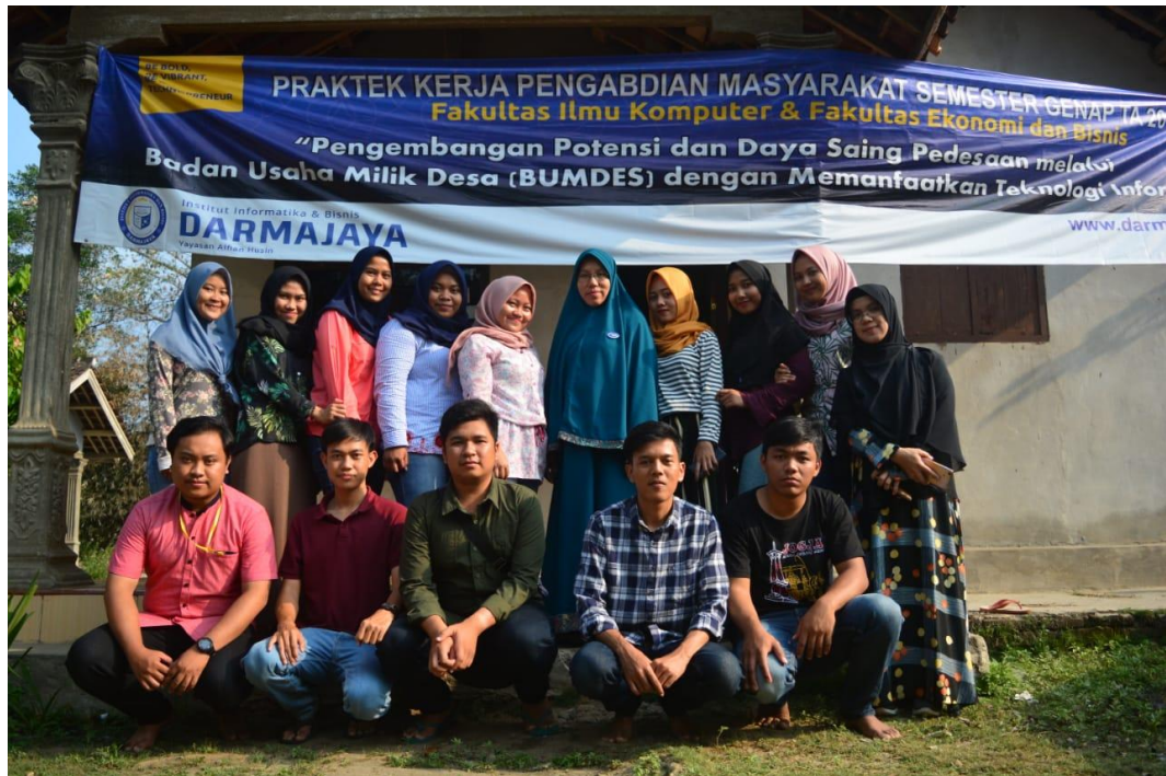
Kunjungan Dosen Pembimbing Lapangan