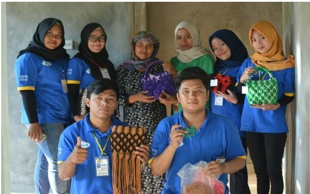
Foto bersama pemilik UKM tas rajut Dusun Jatirejo