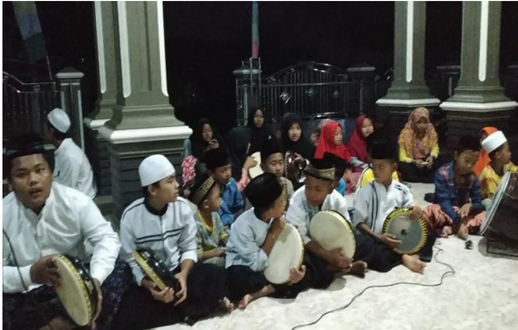
Penampilan hadroh anak-anak Pekon Candiretno