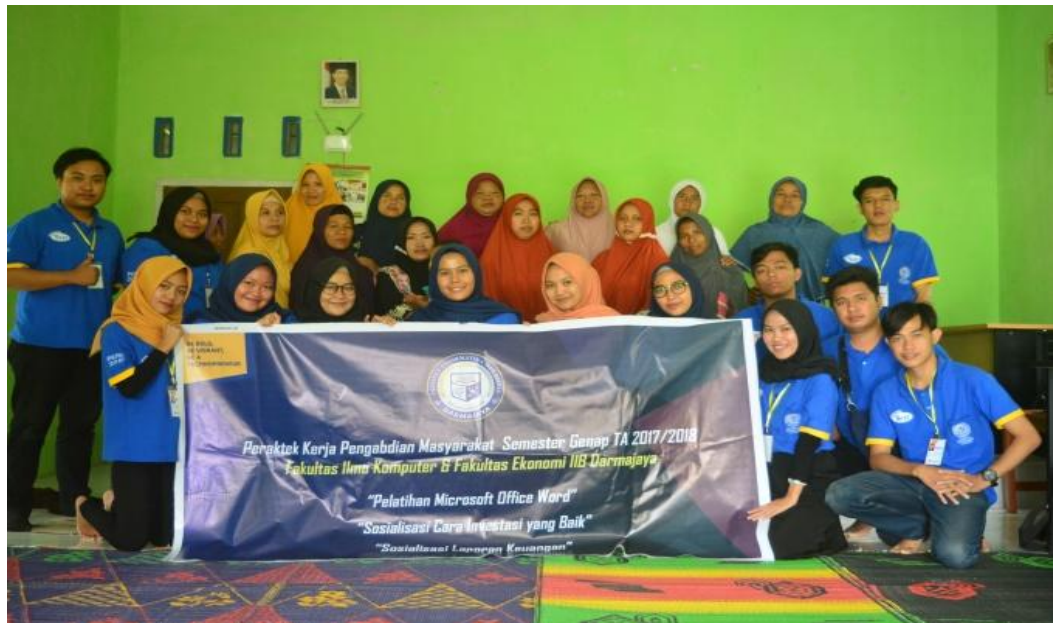
Sosialisasi Bagaimana Investasi yang Baik dan Waspada Investasi Bodong bersama masyarakat Pekon Candiretno