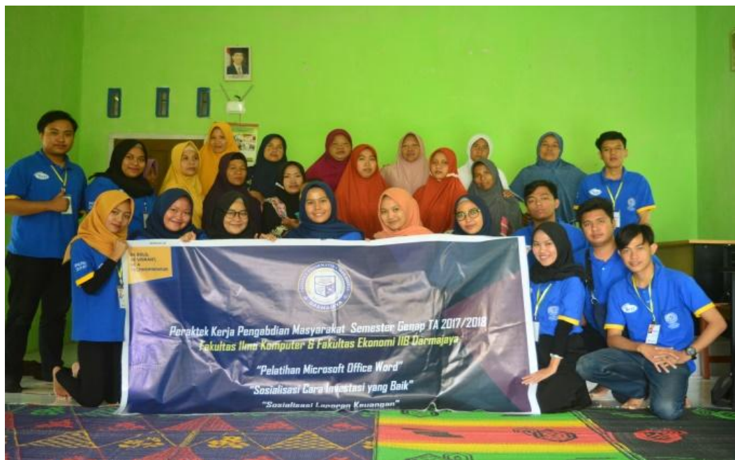
Sosialisasi Bagaimana Investasi yang Baik dan Waspada Investasi Bodong bersama masyarakat Pekon Candiretno