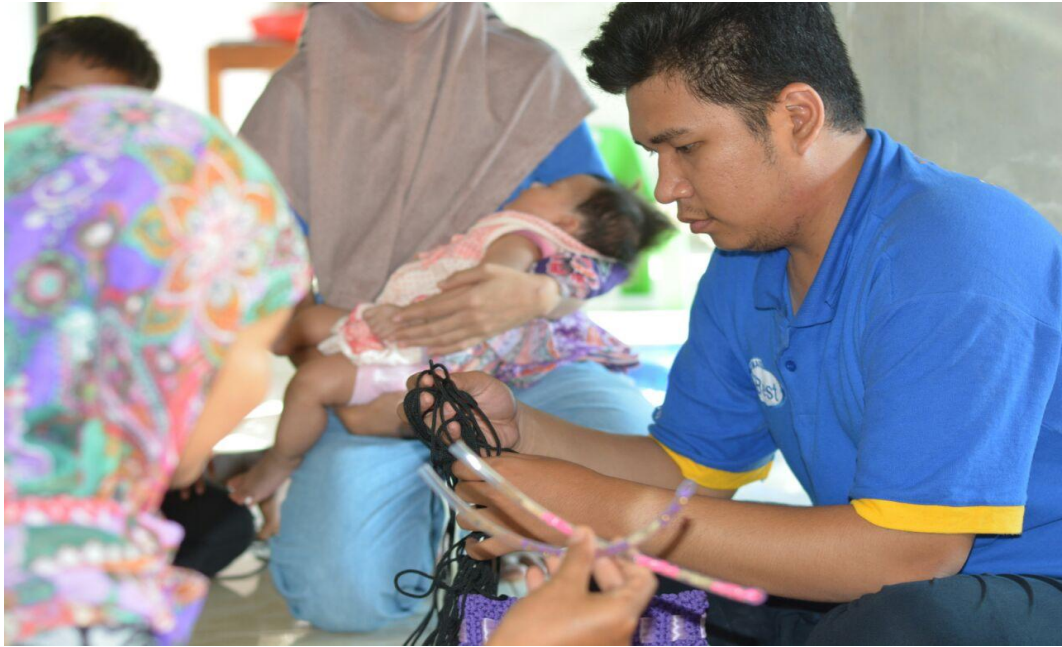
Belajar membuat tas rajut bersama beberapa ibu-ibu di Dusun Jatirejo