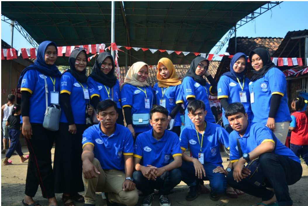
Berpartisipasi menjadi panitia lomba 17 Agustus di Pekon Candiretno