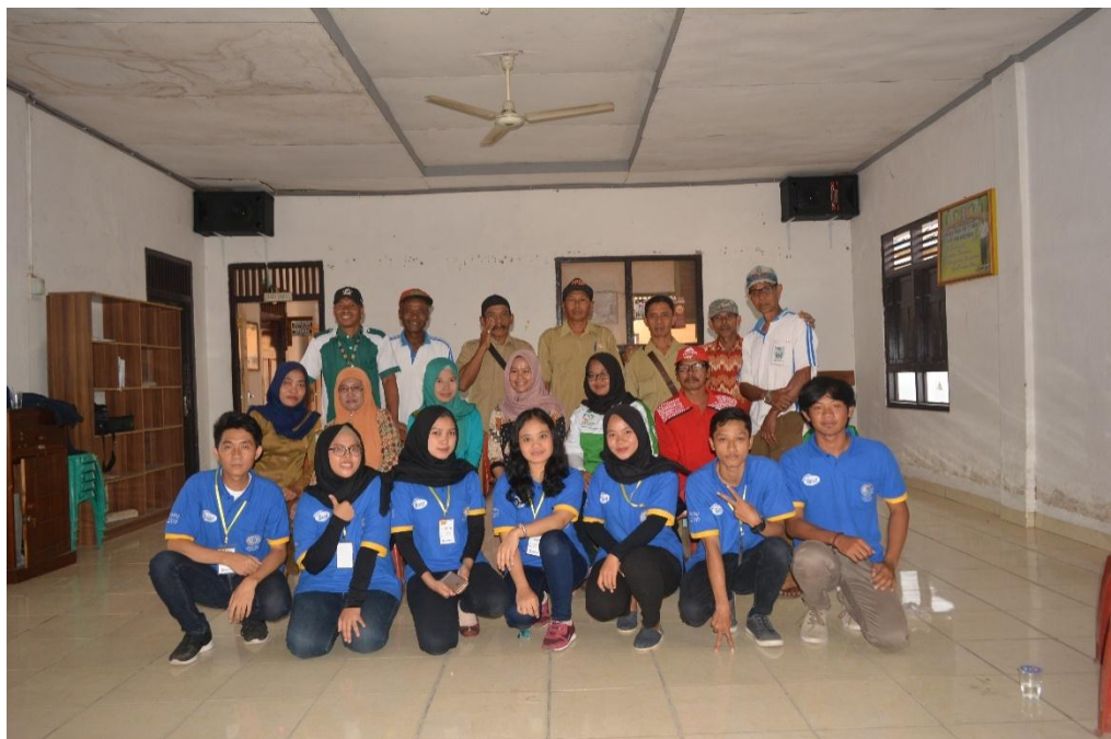
Foto bersama dengan para peserta sosialisasi Galeri investasi