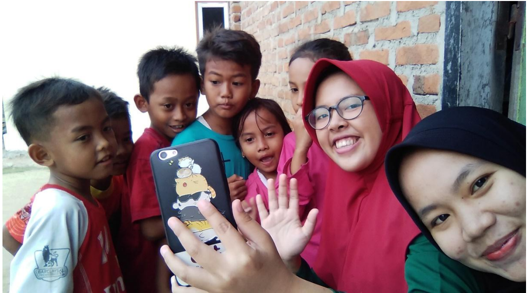
Edukasi Video Pendidikan Pada Anak-Anak Pekon Sidoharjo