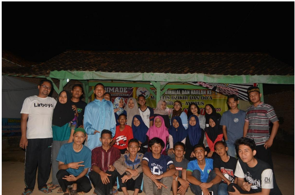
Foto Perpisahan Dengan Masyarakat Pekon Sidoharjo