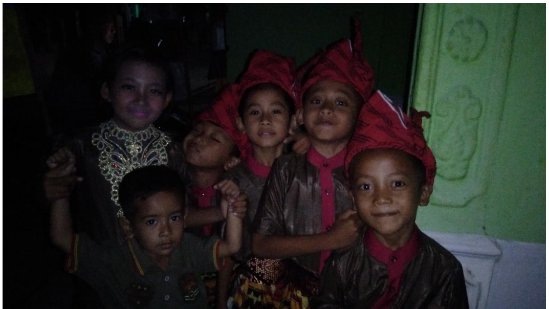
Persiapan Pementasan Tari Tombak Anak-Anak Pekon Sidoharjo Dalam Rangka Perayaan Hari Kemerdekaan