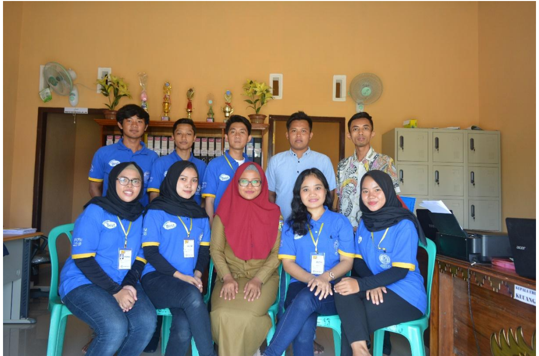
Foto Bersama Dengan Perangkat Desa Pekon Sidoharjo