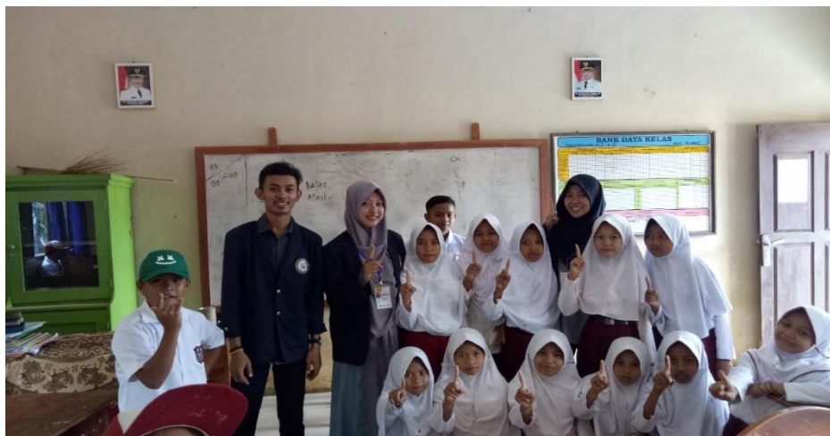
Gambar 21. Bersama Siswa-siswi SD Negeri 2 Sumber Bandung