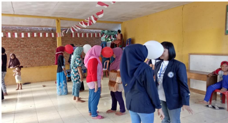
Gambar 9. Kegiatan Perlombaan Joget Balon