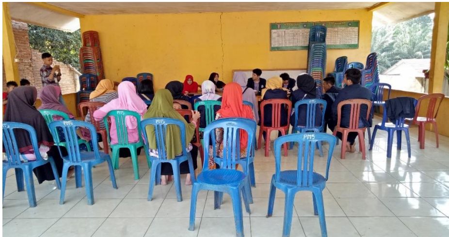
Gambar 12. Rapat Pembahasan Masalah yang ada pada BUMDes