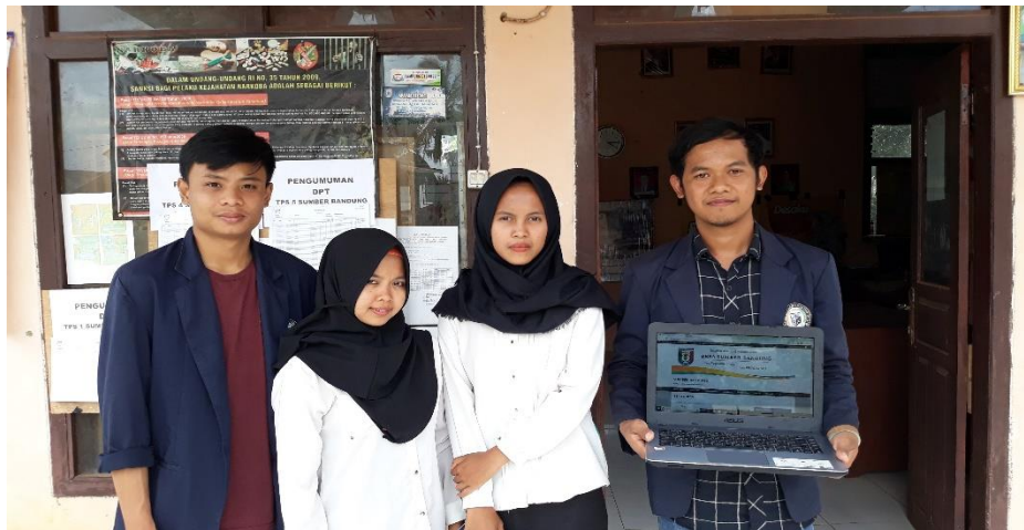
Gambar 24. Penyerahan web desa