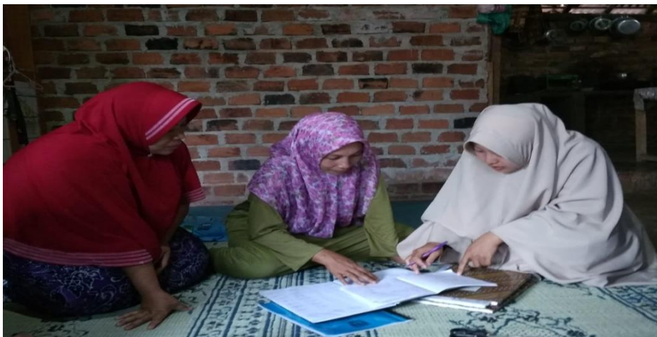
Gambar 18. Pembuatan laporan keuangan BUMDes