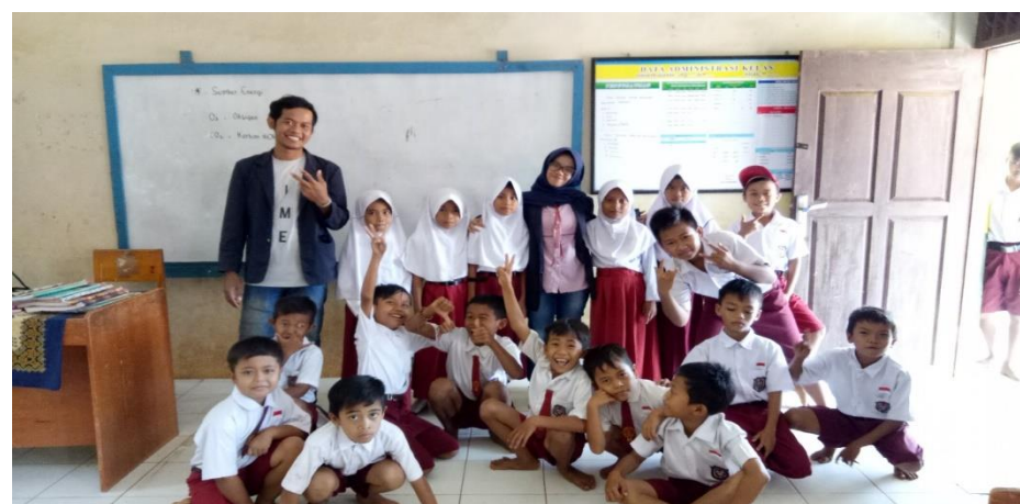
Gambar 22. Bersama Siswa-siswi SD Negeri 2 Sumber Bandung