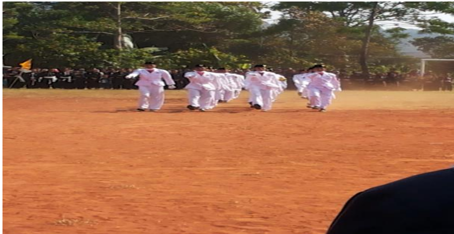
Gambar 5. Mengikuti Kegiatan Upacara Hari Kemerdekaan Di Kec.