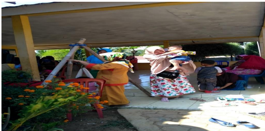
Gambar 4. Mengikuti dan Membantu Kegiatan Posyandu