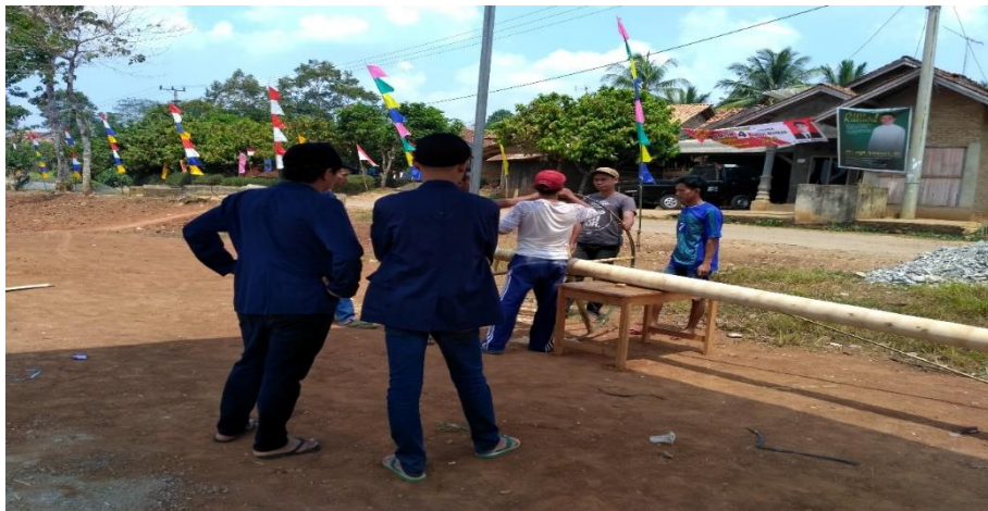
Gambar 6. Membantu Persiapan Perlombaan Panjat Pinang