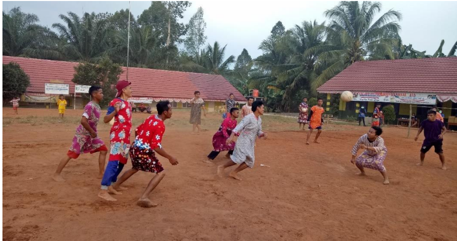
Gambar 11. Kegiatan Perlombaan Sepak Bola Daster