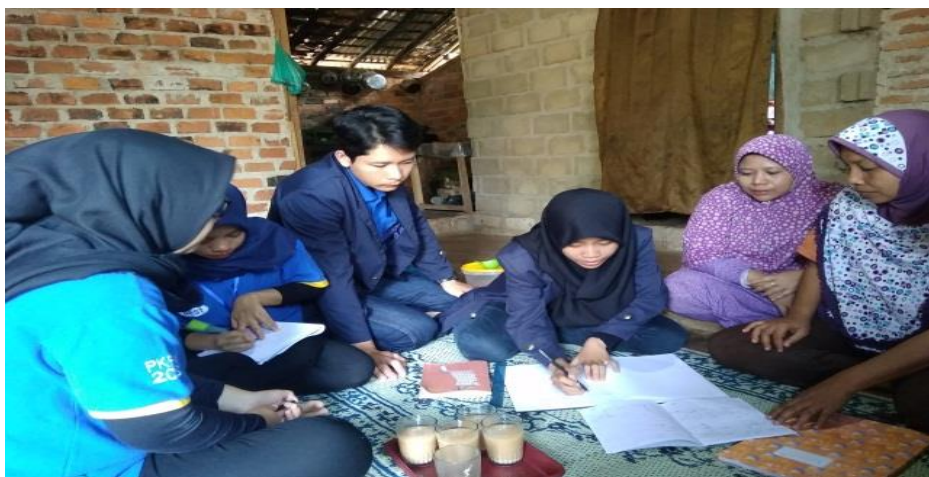
Gambar 16. Pelatihan Perencanaan Anggaran Pada BUMDes