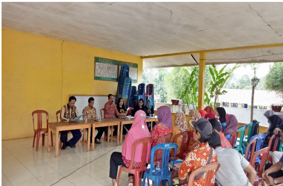
Gambar 2. Pelaksanaan Perlombaan BKKBN