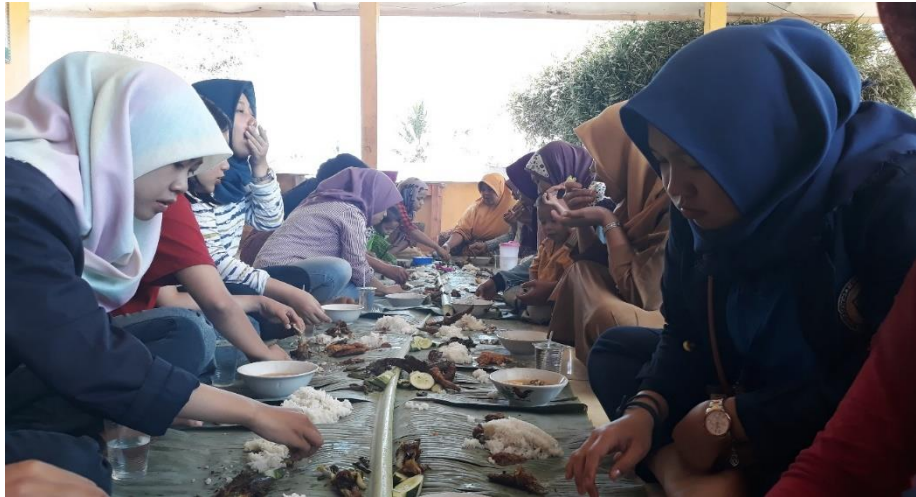
Gambar 26. Dalam Rangka Perpisahaan Dengan Masyarakat Desa