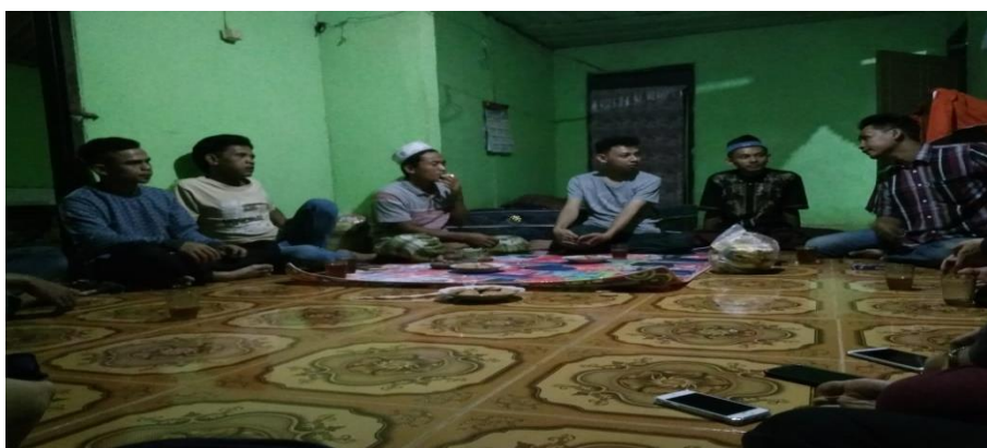
Gambar 4. Pembahasan Mengenai Perlombaan dalam Rangka Hari Kemerdekaan