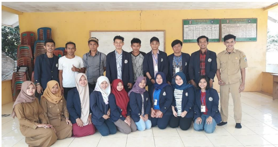
Gambar 28. Dalam Rangka Perpisahaan Dengan Masyarakat Desa