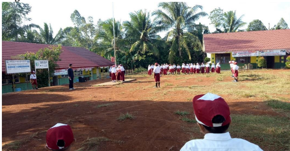
Gambar 19. Mengikuti Kegiatan Upacara Di SD Negeri 2 Sumber Bandung