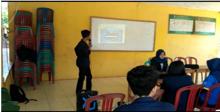
Gambar 15. Sosialisasi Investasi Bodong dan Pengenalan Saham