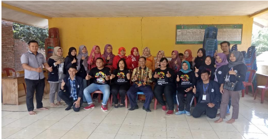
Gambar 3. Pengumuman Pemenang dan Penutupan Perlombaan BKKBN