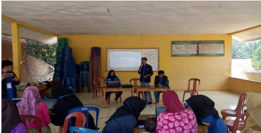
Gambar 14. Pelatihan Microsoft Office kepada Aparatur Desa dan BUMDes