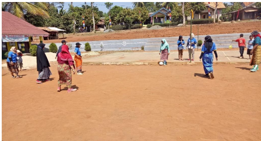
Gambar 10. Kegiatan Perlombaan Sepak Bola Sarung