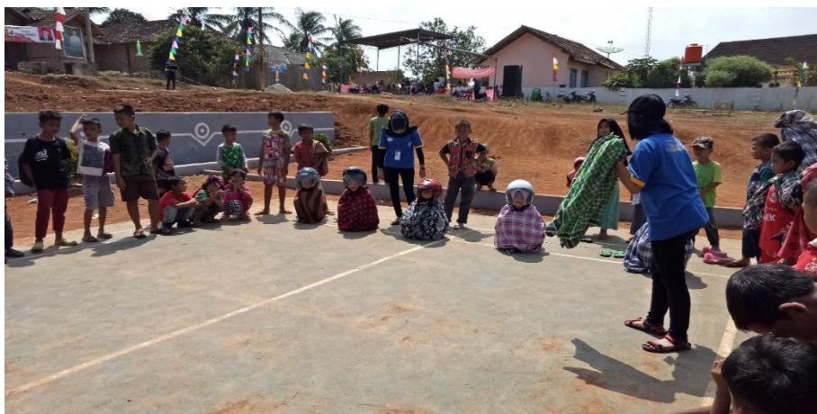
Gambar 7. Kegiatan Perlombaan Balap Sarung