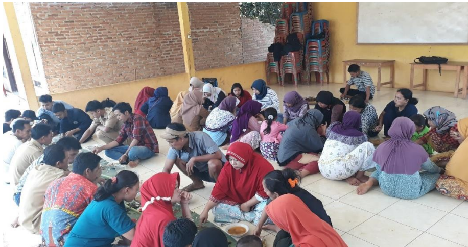
Gambar 27. Dalam Rangka Perpisahaan Dengan Masyarakat Desa