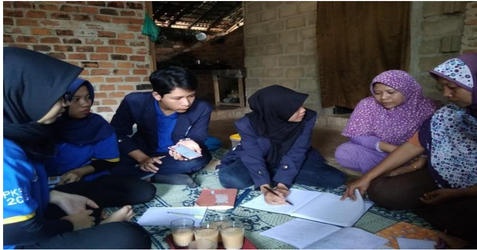
Gambar 17. Pelatihan Pembukuan Simpan Pinjam