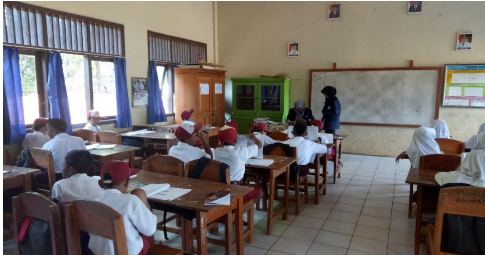
Gambar 20. Membantu Proses Belajar Mengajar