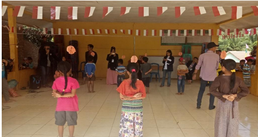
Gambar 8. Kegiatan Perlombaan Makan Kerupuk