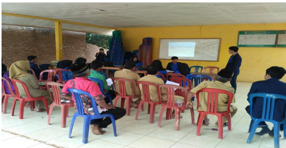
Gambar 13. Penyampaian Materi Repitalisasi Struktur BUMDes