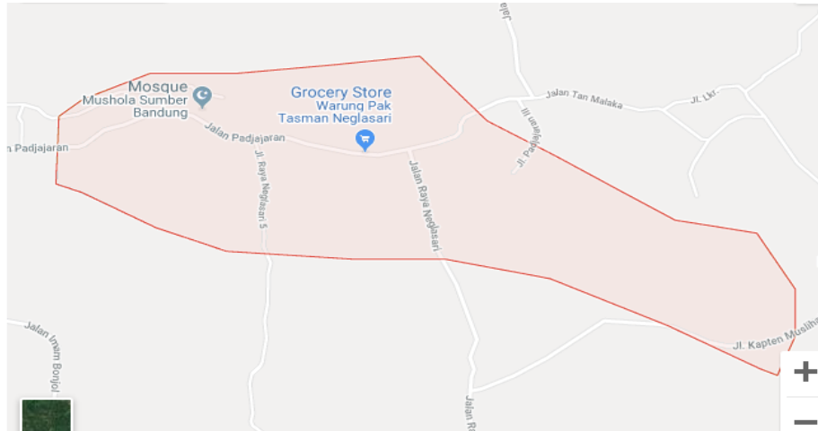
Gambar 1. Denah Lokasi PEKON Sumber Bandung Kec. Pagelaran Utara