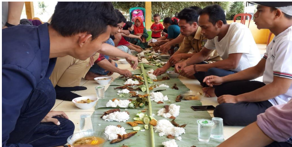
Gambar 25. Dalam Rangka Perpindahan Dengan Masyarakat Desa