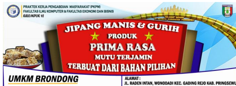
Gambar 7 : Desain Banner UMKM Brondong