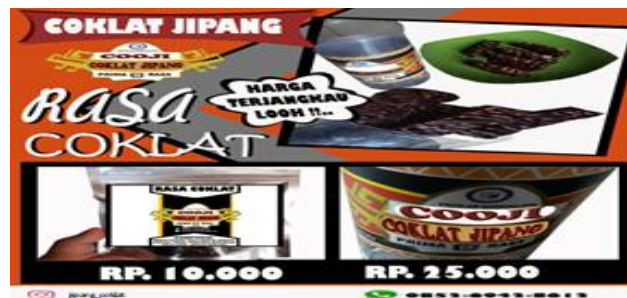
Gambar 3 : Pamflet Coklat Jipang