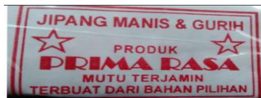
Gambar 1 : Desain Sebelum

Pada sebelumnya label produk UMKM Brondong yang ada di Pekon Wonodadi masih ada kekurangan dari segi desain warna pada label tersebut sehingga mahasiswa PKPM IIB Darmajaya membuat desain label yang terbaru, dan lebih menarik lagi dari desain label pada sebelumnya. Berikut ini adalah gambar label sebelum di desain ulang oleh Mahasiswa PKPM IIB Darmajaya :