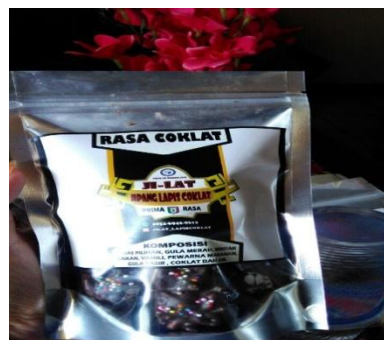
Gambar 4.9 Stiker design yang ditempel di standing pouch