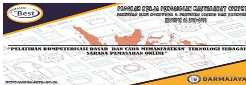
Gambar 8 : Desain Banner Pelatihan Komputerisasi dasar