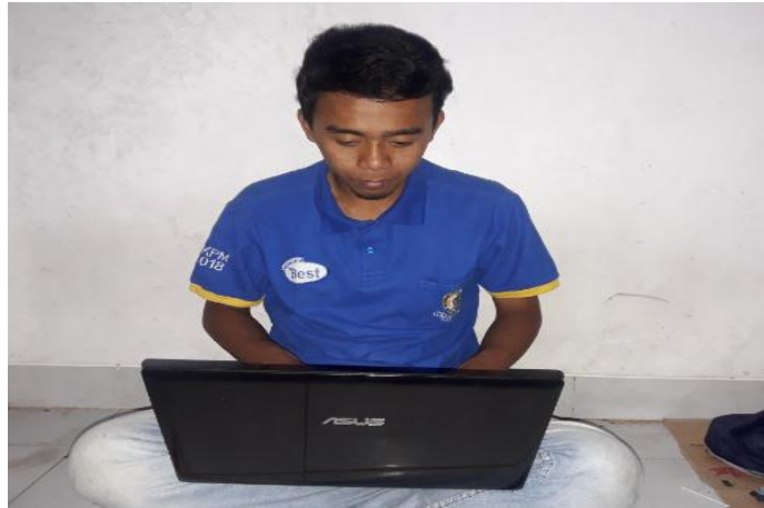
Gambar 1 : Proses Pengeditan Video dengan menggunakan laptop

Video ini memerlukan waktu yang lumayan lama dan memakan waktu, dengan kerjasama dari teman-teman untuk pengeditan Video yang kami kerjakan berjalan dengan lancar. Berikut ini adalah gambar dari proses pengeditan Video yang telah kami buat seperti gambar dibawah ini :