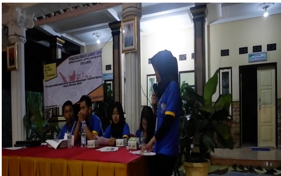
Gambar 1.4 penjelasan materi tentang waspada investasi bodong