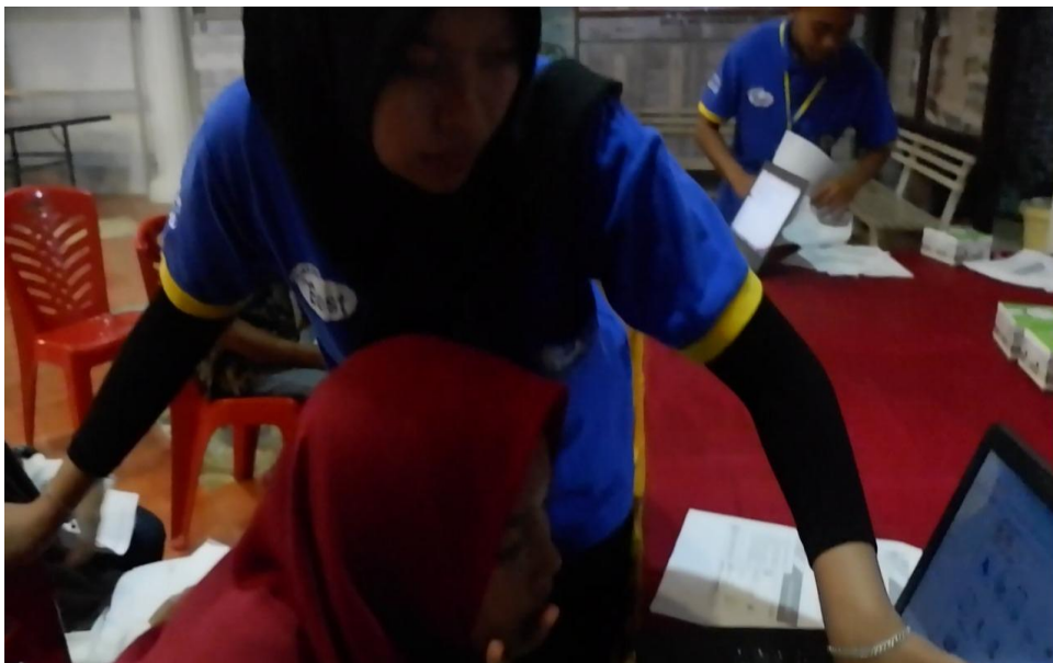
Gambar 1.6 pembelajaran menabung saham atau trading online dengan komputer.