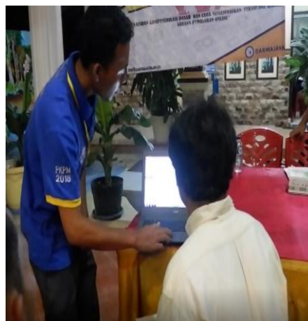
Gambar 1 : Pelatihan Komputerisasi Dasar Untuk Aparatur Desa

Program kegiatan pelatihan komputerisasi dasar ini diberikan kepada aparatur Desa Pekon Wonodadi. Guna untuk meningkatkan wawasan dan pengetahuan yang lebih jauh lagi dari sebelumnya, dengan adanya pelatihan komputerisasi dasar ini sangat di berguna untuk aparatur desa, dan pada sat pelatihan tersebut aparatur Desa sangat antusias dalam menerima ilmu dalam pelatihan yang kami berikan kepada aparatur desa Pekon Wonodadi. Semoga ilmu yang kami berikan menjadi manfaat bagi aparatur Desa Pekon Wonodadi. Adapun Beberapa gambar pada saat pelatihan Komputerisasi Dasar untuk aparatu Desa Pekon Wonodadi.