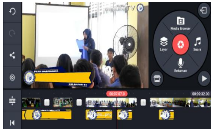
Gambar 3 : Pengeditan Video dengan Aplikasi KineMaster di handphone .