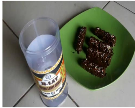
Gambar 4.5 Proses Pengemasan