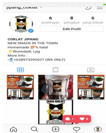
Gambar 1. Akun instagram jipang coklat