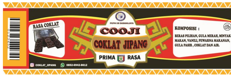
Gambar 2 : Desain label untuk kemasan toples

berbeda dari pada desain Standing Pouch . Berikut ini adalah gambar desain label untuk kemasan Toples pada Inovasi Coklat Jipang.