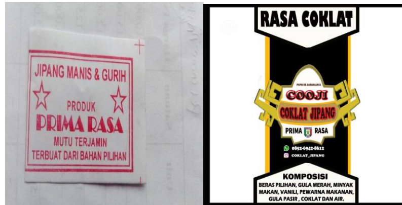
Gambar 4.6 Design Merk yang Digunakan untuk produk sebelum dan sesudah