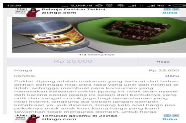
Gambar 2 : Akun olx Jipang coklat.