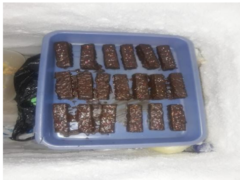
Gambar 4.4 Proses Pendinginan