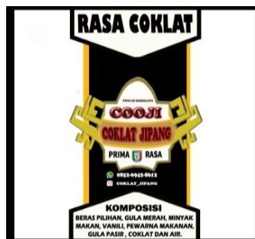
Gambar 1 : Label untuk kemasan Standing Pouch