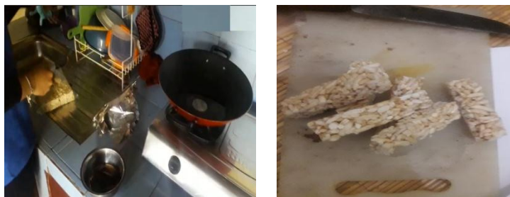
Gambar 4.1 Proses Pematangan Jipang Manis