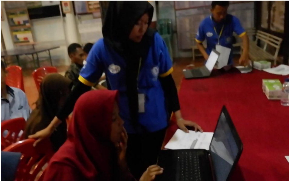
Gambar 1.5 pelatihan menabung saham kepada aparatur desa dan pelajar atau mahasiswa yang ada di desa wonodadi.