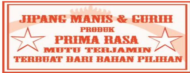
Gambar 2 : Desain Sesudah