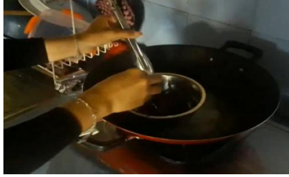
Gambar 4.2 Proses Pelelehan Coklat