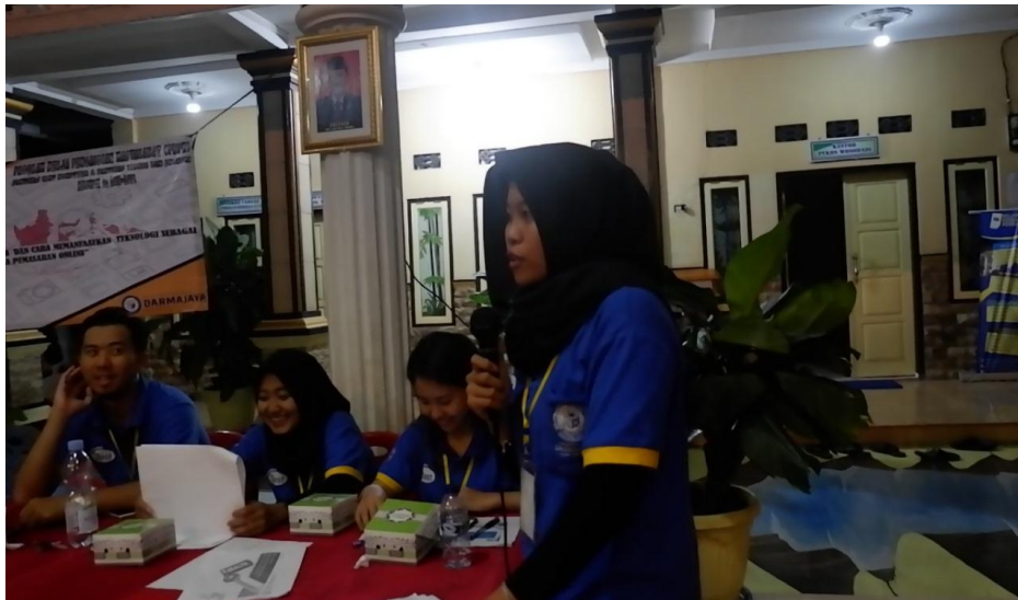
Gambar 1.3 sosialisasi waspada investasi bodong kepada aparatur desa dan masyarakat desa wonodadi.