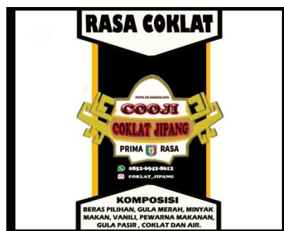
Gambar 4.8 Design kemasan coklat jipang