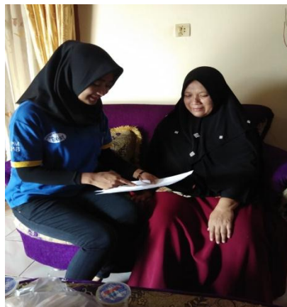
Gambar 1.1. Dokumentasi pada saat kami memberi pelatihan penyusunan Harga Pokok

Tampilan gambar pelatihan penyusunan harga pokok produksi