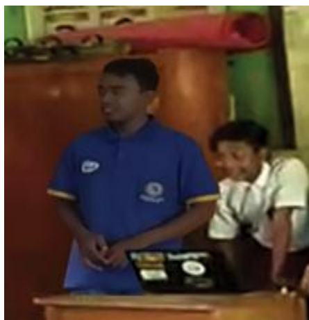
Gambar 2 : Pelatihan Komputerisasi Dasar Untuk Siswa/I SDN 03 Wonodadi

Program pelatihan komputerisasi dasar ini diberikan kepada siswa/i SD Negeri 3 Wonodadi guna untuk meningkatkan pengetahuan kepada Siswa-Siswi SD Negeri 3 Wonodadi kabupaten pringsewu, dengan adanya maksud pelatihan komputerisasi dasar ini agar Siswa/i SD Negeri 3 Wonodadi mendapatkan wawasan yang lebih luas lagi melalui pelatihan komputerisasi dasar ini. Berikut ini adalah Gambar pelatihan komputerisasi dasar di SDN 03 Wonodadi Kecamatan Gadingrejo Kabupaten Pringsewu.