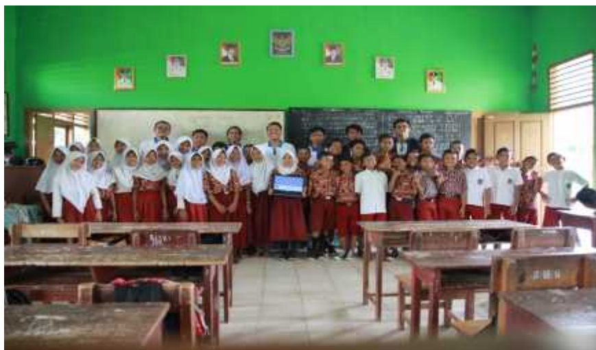
Foto bersama peserta pembelajaran pengaruh internet

Sedangkan Internet (Inteconnected-Network) itu sendiri merupakan sekumpulan jaringan komputer yang menghubungkan berbagai macam situs. Internet menyediakan akses untuk layanan telekomunikasi dan sumber daya informasi untuk jutaan pemakainya yang tersebar di seluruh Indonesia bahkan seluruh dunia. Sepintas internet memang terlihat sangat baik dan menguntungkan, adapun disisi lain karena internet diciptakan untuk memudahkan kehidupan manusia, tetapi bagaimanapun juga internet memiliki sisi negatif yang tidak bisa dihindarkan oleh siapapun, khususnya pada siswa-siswi SDN 01 di pekon Sukoharjo IV, Kec. Sukoharjo, Kab. Pringsewu.