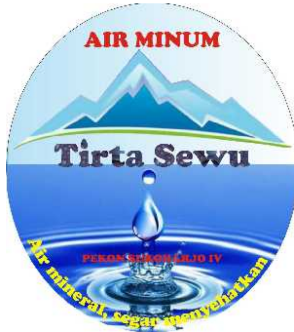
Bentuk logo BUMDES TIRTA SEWU