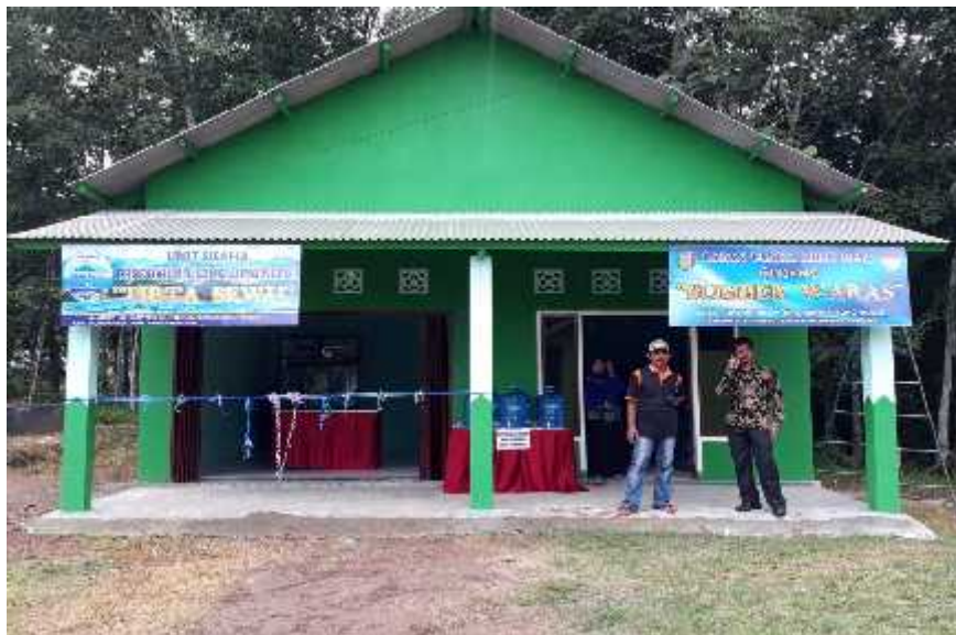
Tampilan gambar yang dicantumkan di WEBSITE pekon

Dilakukan proses promosi yaitu dengan mencetak selebaran brosur dan dibagikan kepada warga setempat setelah itu kami melakukan promosi lewat web desa kami memasukkan data data bumdes tirta sewu yang meliputi gambar, harga, lokasi, dan penjelasan mengenai BUMDES pekon sukoharjo IV.