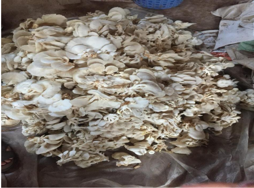
Gambar 2.3 Proses Panen Jamur Tiram