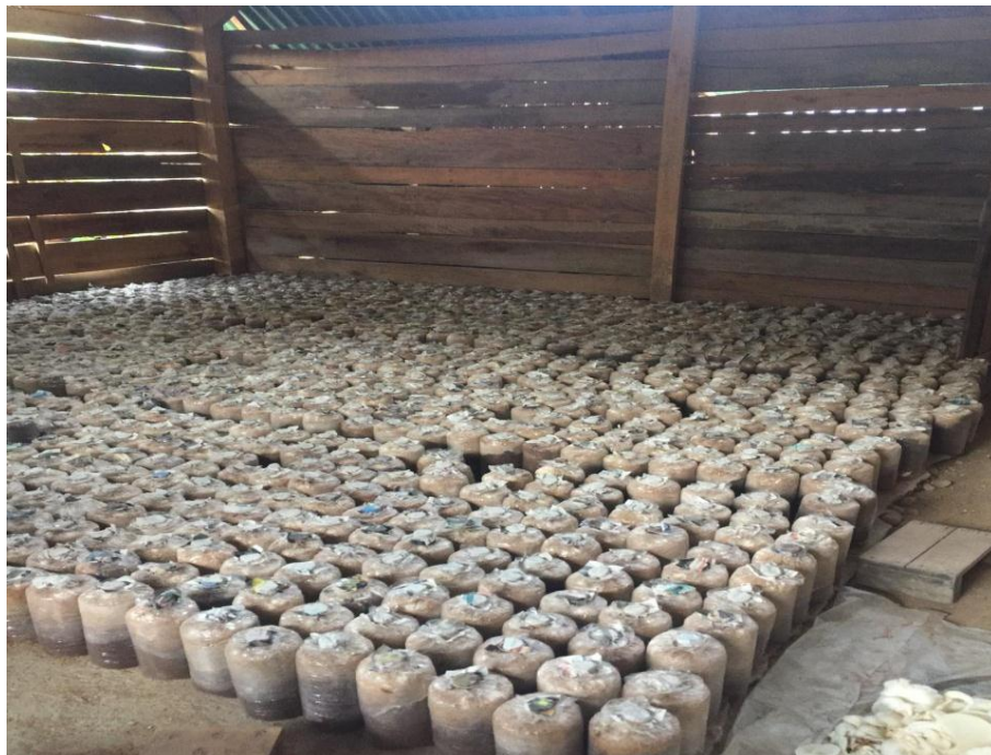
Gambar 2.2 Proses Pembibitan