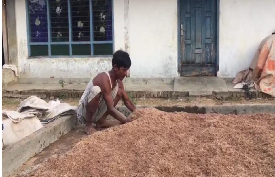
Gambar 2.1 Proses Pencampuran Bahan Jamur Tiram

kurang matang dan kurang steril dalam prosesnya. Kemudian selain itu, di musim kemarau membuat lingkungan menjadi kering sehingga jamur tiram sulit tumbuh.