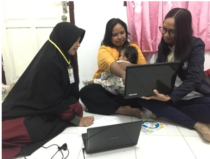
Gambar 4.3 Kegiatan Pelatihan Harga Pokok Produksi