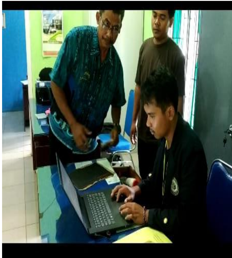
Gambar 4.1 Proses Pembuatan Website