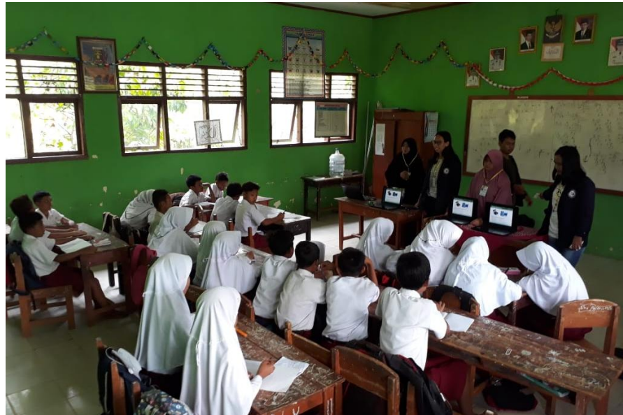
Gambar 4.2 Proses Pelatihan dan Pengenalan Dasar Komputer

duduk di kelas 6 . Kami mengajar dengan durasi waktu satu jam di jam terakhir pelajaran. Anak-anak disana sangat antusias dengan program pelatihan yang kami berikan, kami juga membuat beberapa pertanyaan agar di dalam kelas dapat aktif dan yang bisa menjawab pertanyaan akan mendapatkan hadiah berupa makanan ringan. Dan mereka berlomba-lomba untuk menjawab pertanyaan dari kami.