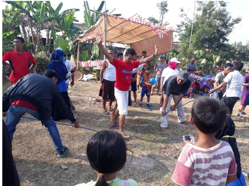
Gambar 4.5 Kegiatan 17 Agustus 2018

berlangsung sampai pukul 17.00 WIB yang diakhiri dengan pembagian hadiah.