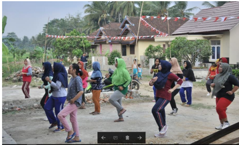
Gambar 4.10 Pelatihan Senam Ibu – Ibu PKK