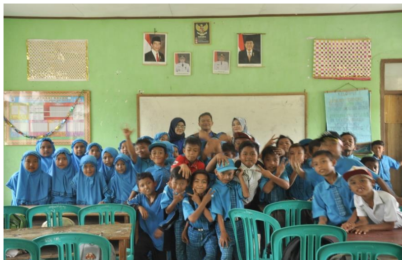
Gambar 4.8 Pelatihan Komputer di SD N 4 Way Khilau