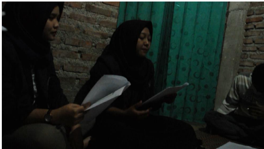
Gambar 4.3 Sosialisai tentang Investasi Palsu

Menurut Dwi Ariani (2015) investasi bodong adalah investasi yang tidak jelas sumber dana serta pengolahannya. Investasi bodong umumnya melibatkan dua pihak yaitu “sibohong” dan “sibodoh”. Sosialisai ini dilakukan untuk membagi pengetahuan kepada masyarakat desa penengahan tentang investasi illegal dan investasi legal. Serta bertujuan agar masyarakat desa dapat jeli dan teliti dalam setiap penggunaan dana untuk sebuah investasi.