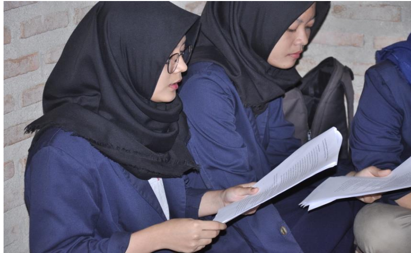
Gambar 4.6 Sosialisasi cara pemasaran product