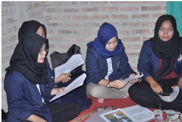
Gambar 4.4 Sosialisasi tentang laporan keuangan

BUMDes diharapkan aparaturnya dapat mengetahui arti keseluruhan tentang BUMDes. Dan untuk sosialisasi laporan keuangan selain bertujuan menambah wawasan juga bertujuan agar pengurus BUMDes dapat memperhitungkan dengan teliti dan cermat setiap terjadinya transaksi masuk maupun keluar.