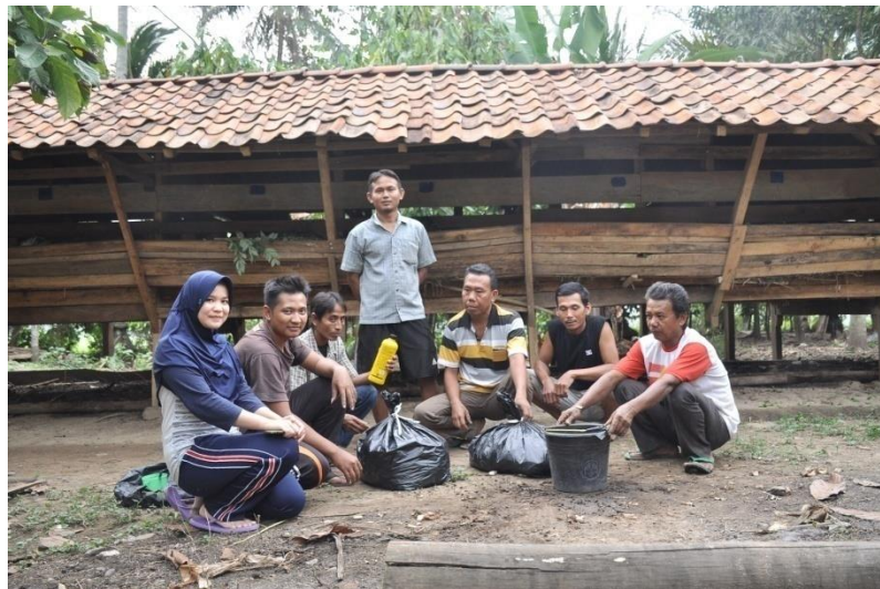
Gambar 4.7 Pembuatan Pupuk Kompos