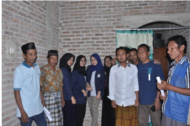
Gambar 4.5 sosialisasi tentang pemberdayaan SDM