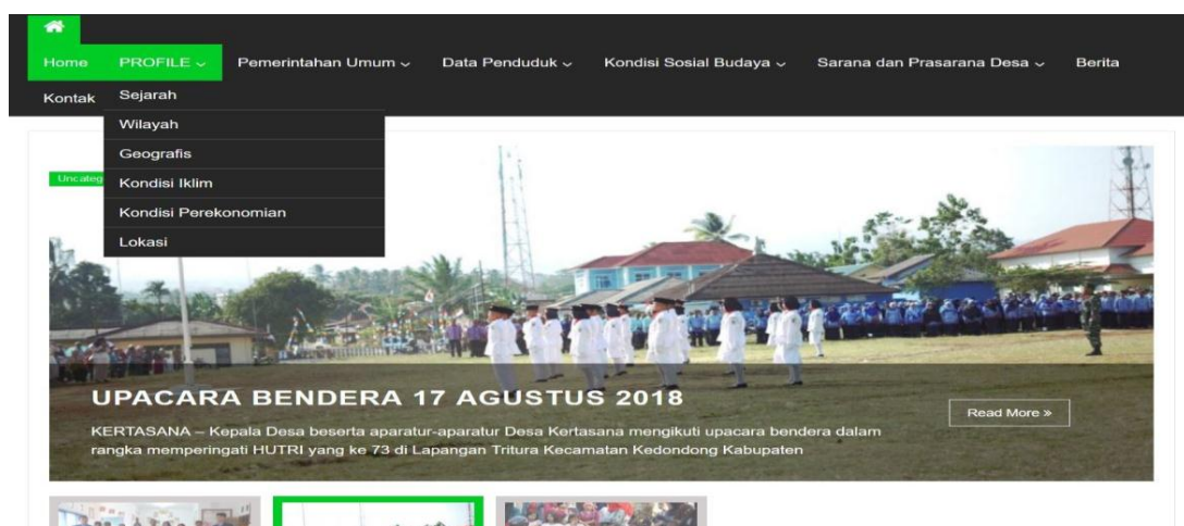
Gambar 4.1 Halaman Home website Desa Kertasana

Website Desa Kertasana bisa diakses dengan domain http://localhost/kertasana/ . Fitur-fitur yang terdapat didalam website tersebut adalah berupa: Fitur Beranda/ Home , Profil Desa (meliputi Visi&Misi, Struktur Perangkat Desadan Peta Desa), fitur Pelayanan (meliputi tata cara pembuatan KTP, KK, dan Akta), fitur UKM desa, fitur inventaris Desa, dan fitur Berita. Dengan adanya fitur-fitur tersebut secara keseluruhan semua pelaksanaan kegiatan Desa bisa terekam dan diketahui melalui website Desa dan masyarakat luas bisa mengetahui keberadaan Desa Kertasa. Berikut gambar website yang telah diunggah: