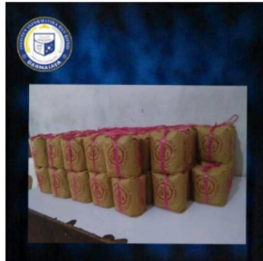
Gambar 3. Kopi dalam Kemasan Siap di pasarkan

Selain perbaikan tampilan kemasan, dilakukan pembangunan media pemasaran online menggunakan free webstore dan sophie untuk menampilkan informasi tentang produk kopi enak 999 seperti ditunjukkan pada Gambar 4 dan Gambar 5 berikut ini: