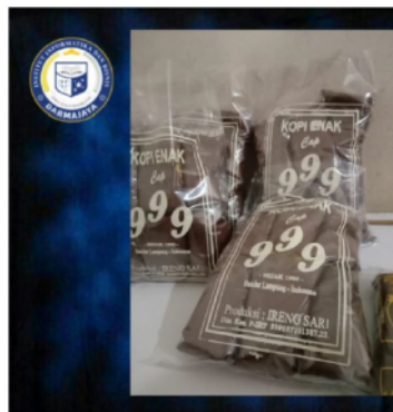
Gambar 2. Kopi dalam Kemasan Plastik (Bagian Dalam)

Setelah dilakukan desain kemasan, dilanjutkan dengan proses penyablonan plastik yang akan digunakan untuk menampung kopi bubuk. Beberapa contoh kemasan kopi bubuk ditunjukkan pada Gambar 2 berikut ini: