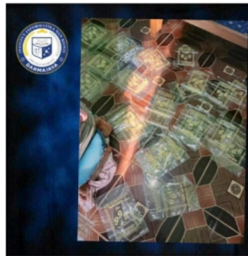
Gambar 1. Proses Penyablonan Kemasan

Berdasarkan hasil identifikasi permasalahan yang menunjukkan bahwa permasalahan utama yang dihadapi oleh UMKM kopi enak adalah pada kemasan produk dan jangkauan pemasara yang masih sangat sempit. Berkaitan dengan hal tersebut maka pendampingan difokuskan pada desain kemasan dan pembangunan media pemasaran dan penjualan online. Hasil desain kemasan ditunjukkan pada Gambar 1 dan Gambar 2 berikut ini: