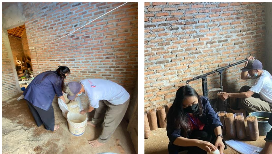
Gambar 2.6 Pembuatan Baglog Jamur

Bahan-bahan terdiri dari Serbu kayu, kapur, dedek, air. Semua bahan dicampurkan lalu di aduk. Setelah itu dilanjutkan dengan memasukkan bahan-bahan kedalam wadah baglog.