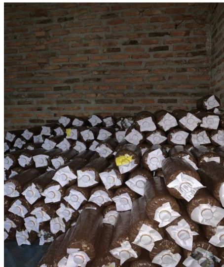
Gambar 2.12 Pembibitan Baglog Jamur