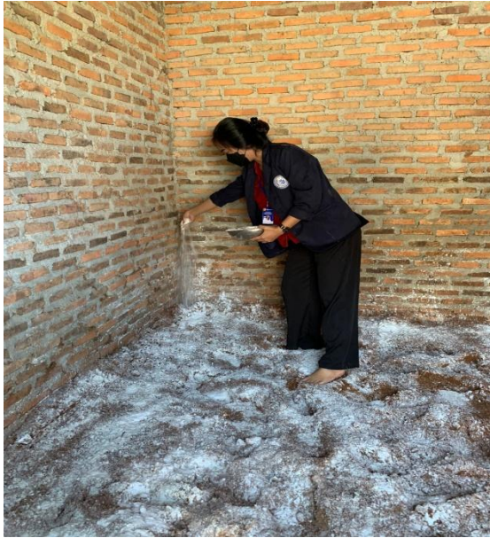
6. Pengadukan Semua Bahan Baglog