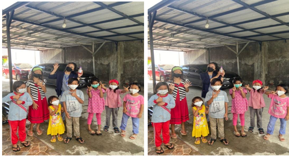
Gambar 2.5 Sosialisasi Pencegahan Covid-19