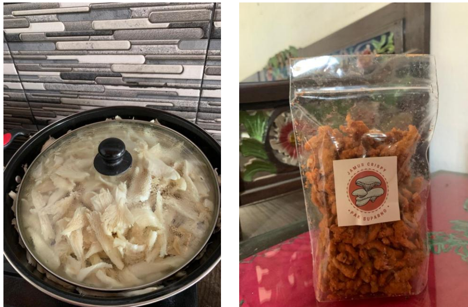
Gambar 2.13 Pengolahan Jamur

Jamur tiram dapat diolah menjadi berbagai makanan, banyak masyarakat yang menyukai jamur tiram karena rasanya yang lezat dan manfaatnya yang banyak bagi kesehatan tubuh. Oleh karena itu saya mengajarkan bapak suparno untuk mengolah jamur tiram menjadi jamur crispy yang siap dijual di media sosial dengan tujuan untuk membantu menambah pendapatan beliau di situasi yang sedang sulit karena Covid-19 saat ini.