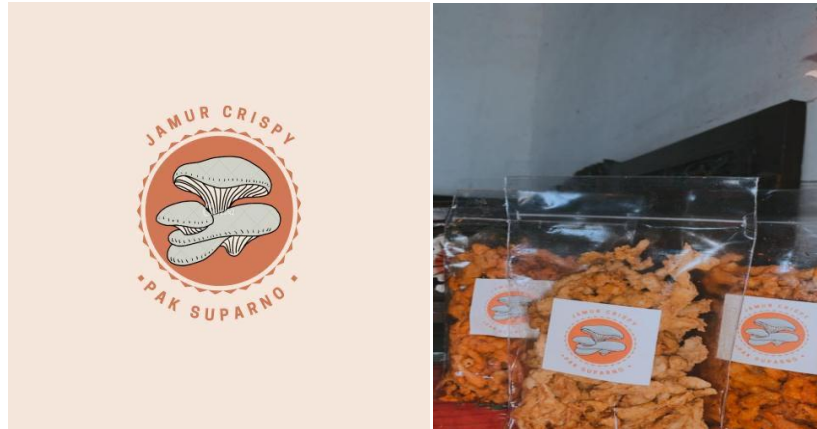
Gambar 2.8 Merk dan Packing UMKM

efektifitas, efisiensi dan fungsi yang sesuai baik dalam produksi kemasan sampai kegunaan kemasan.