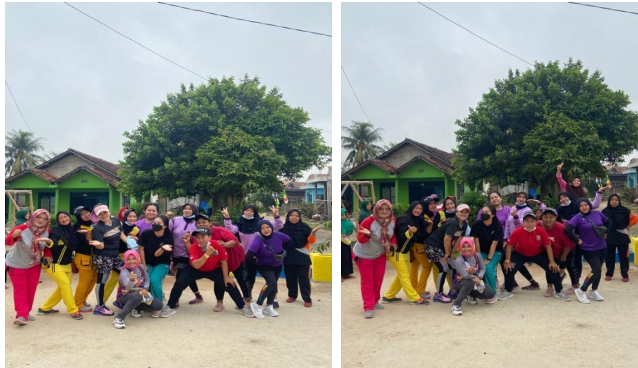
Gambar 2.10 Senam

Warga desa merak batin melakukan senam pagi bersama yang menjadi kegiatan rutin di desa ini. Senam pagi diadakan setiap hari minggu di pandu oleh instruktur sanam. Senam sangat bermanfaat untuk menjaga metabolisme tubuh agar terhindar dari penyakit.