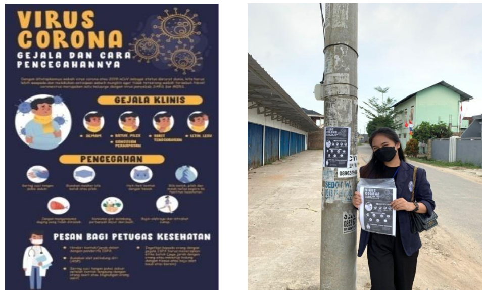
Gambar 2.7 Pamflet Protokol Kesehatan

Membuat pamflet mengenai pencegahan covid-19 sebagai sarana sosialisasi kepada masyarakat sangat efektif di masa pandemi covid-19 saat ini. Dengan adanya pamflet pencegahan Covid-19 diharapkan dapat membantu dalam upaya pencegahan penularan virus corona.