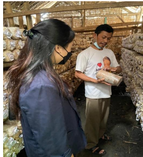
Gambar 2.1 Kunjungan UMKM