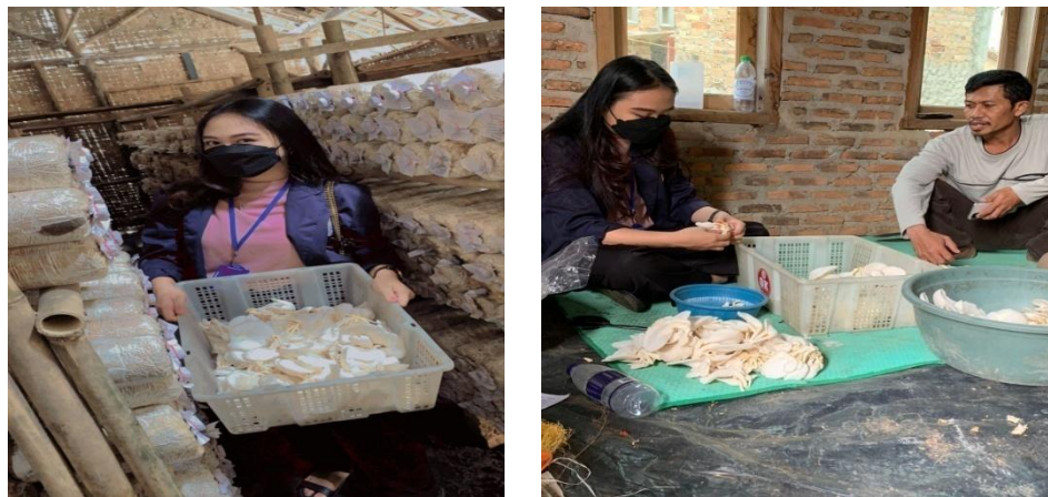
Gambar 2.3 Kegiatan UMKM

Di desa merak batin terdapat budidaya jamur tiram, Saya membantu kegiatan yang berada di UMKM Jamur tersebut, seperti memanen jamur tiram lalu memisahkan jamur yang kualitas nya bagus dan tidak.