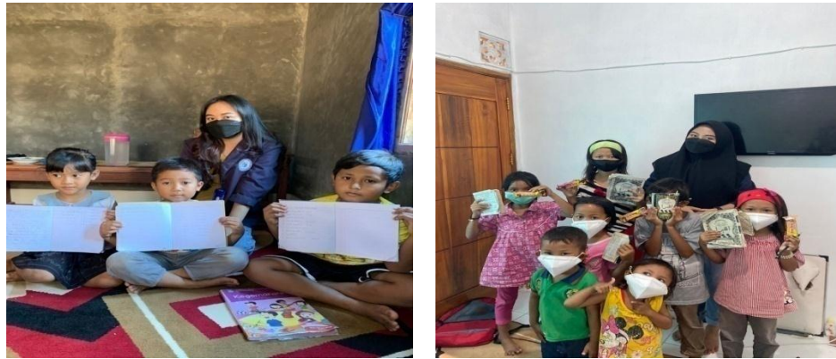
Gambar 2.4 Mengajar Anak-anak sd

Melakukan Pendampingan pembelajaran tatap muka dengan anak SD di Desa Merak Batin dengan belajar seperti berhitung, menghafal perkalian, mengaji, dimasa pandemi covid-19 agar mereka mendapat pengetahuan lebih yang tidak hanya diterima dari sekolah saja.