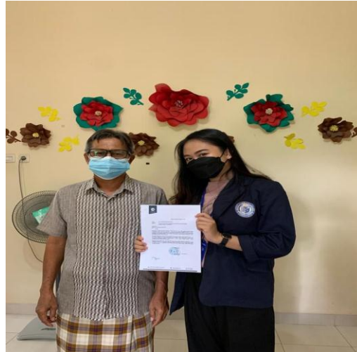
Gambar 2.2 Kunjungan RT

untuk memintan Izin kepada Bapak RT untuk melaksanakan PKPM selama satu bulan.