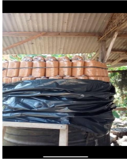
2.11 Sterilisasi Baglog Jamur