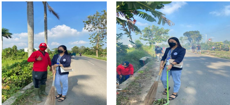
Gambar 2.9 Gotong Royong

Saya melakukan kegiatan Gotong Royong yang dilakukan pada hari dengan bergotong royong yang dilakukan disetiap hari Minggu bersama masyarakat Desa Merak Batin untuk membersihkan sekitar jalan Desa Merak Batin agar Desa tetap bersih & terjaga dari polusi.