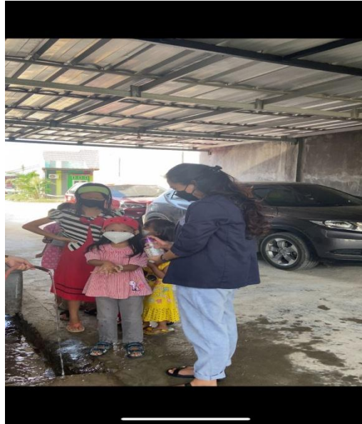
4.Penyiraman Baglog Jamur