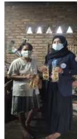
Gambar 2.20 Mempromosi