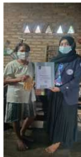
Gambar 2.6 Izin Pemilik UMKM