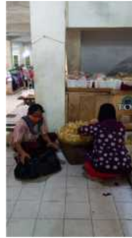
Gambar 2.17 Memasarkan