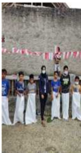
Gambar 2.4 Lomba Balap Karung