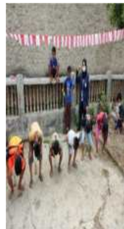
Gambar 2.3 Memasukkan paku dalam botol