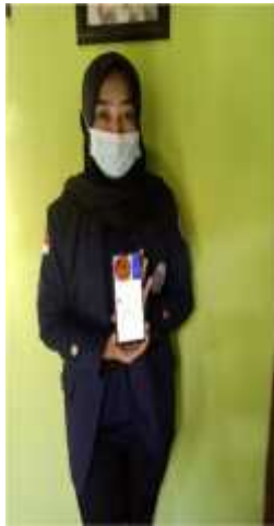
Gambar 2.27 Membuatkan Denah Lokasi

Minggu keempat hari senin membuatkan denah lokasi untuk UMKM bu asih agar konsumen mengetahui rumah produksi klaning Bu Asih, kemudian hari selasa membuatkan media sosial seperti Whatsapp dan facebook lalu hari selanjutnya hari rabu mempromosikan klaning Bu Asih lewat akun media sosial Bu Asih yang telah dibuatkan. Kemudian hari kamis membuatkan website untuk UMKM klaning bu asih dan hari sabtu membuatkan bener untuk di pasang di depan rumah produksi Bu Asih, lalu hari minggu memasangkan bener di depan produksi Bu Asih.