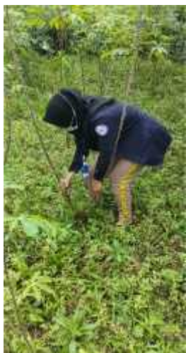
Gambar 2.7 Mencabut Singkong