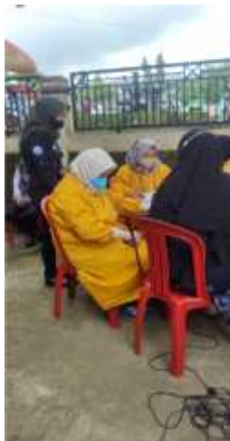
Gambar 2.18 Vaksin Covid-19