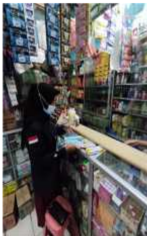
Gambar 2.2 mempersiapkan Hadiah