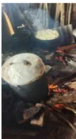
Gambar 2.11 Pengrebusan