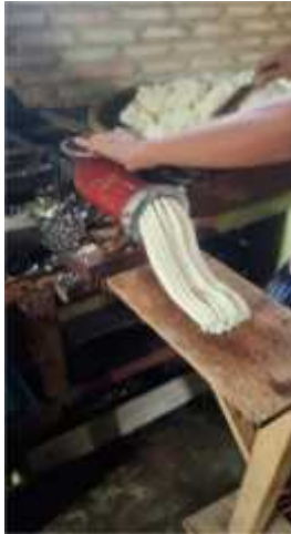
Gambar 2.13 Penggilingan Tahap 2