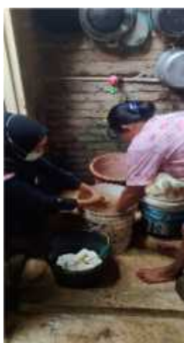
Gambar 2.10 Mencuci Singkong