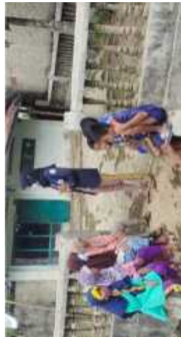
Gambar 2.19 Sosialisasi Protocol Kesehatan