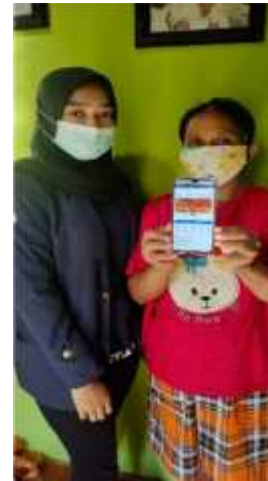
Gambar 2.29 Membuatkan Facebook