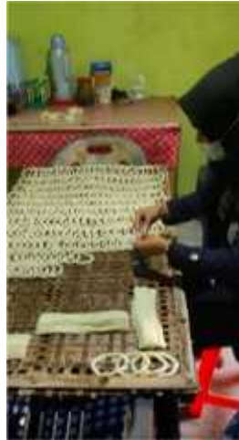
Gambar 2.14 Mencetak Kelanting