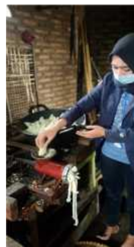
Gambar 2.12 Penggilingan Tahap 1