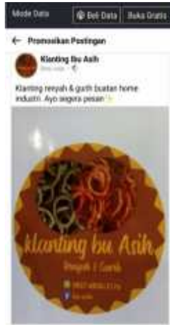
Gambar 2.31 Promosi di Facebook