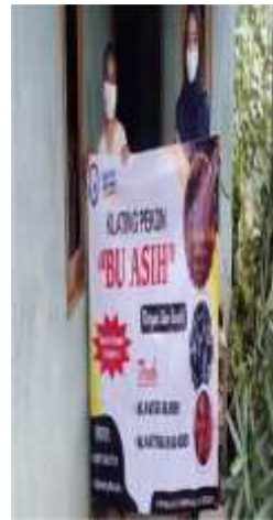
Gambar 2.34 Memberikan Bener