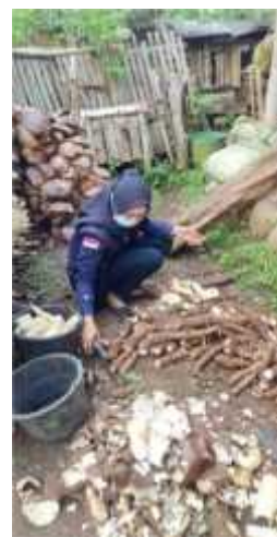
Gambar 2.9 Menupas Singkong