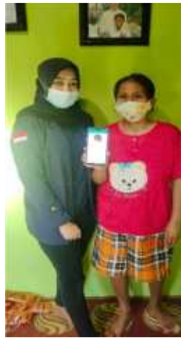
Gambar 2.28 Membuatkan Whatsapp