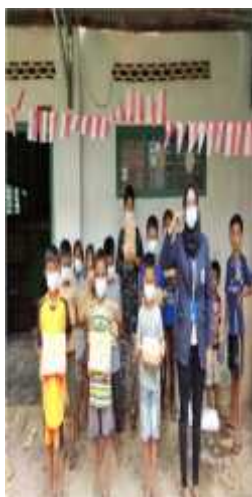
Gambar 2.5 Membagikan Hadiah