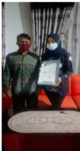
Gambar 2.1 Izin Pak RT