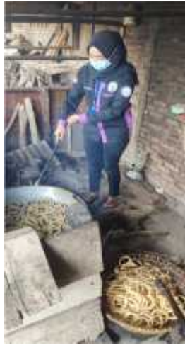
Gambar 2.16 Penggorengan