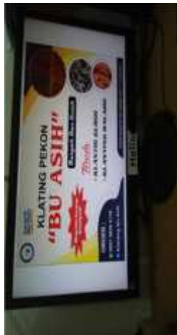
Gambar 2.33 Membuatkan Bener