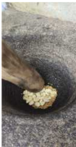
Gambar 2.8 Rempah – Rempah