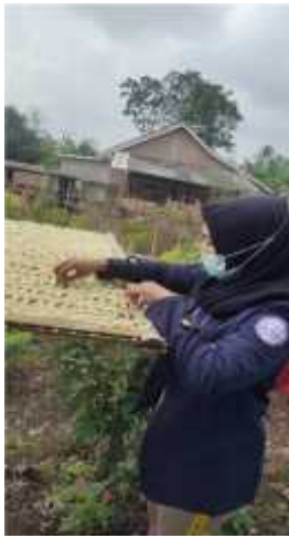
Gambar 2.15 Penjemuran