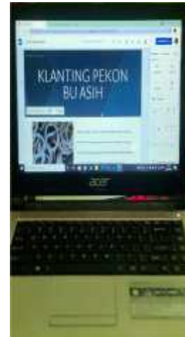
Gambar 2.32 Membuatkan Website