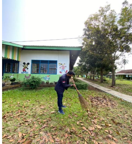
Gambar 2.5 Membantu Membersihkan Lingkungan Sekitar