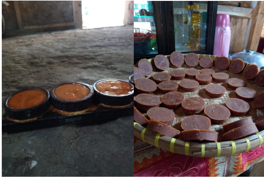
Gambar 2.3 Proses Pembuatan Gula Merah