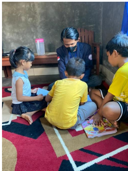
Gambar 2.7 Pendampingan Belajar Siswa Sekolah Dasar

Hasil kegiatan dari program kerja yang telah saya lakukan ini yaitu saya dapat mendampingi dan membantu adik-adik dalam belajar online disaat pandemi virus corona (COVID-19). karena mereka sangat mengalami kesulitan disaat hanya belajar dari rumah. setelah saya melakukan kegiatan ini mereka senang mendapatkan sedikit ilmu dari saya dan merasa lebih mudah dalam memahami pelajaran yang diberikan oleh guru nya setelah saya dampingi.