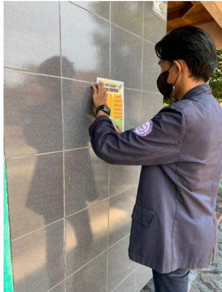
Gambar 2.8 Pemasangan Poster Pencegahan Covid-19