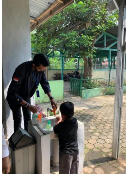
Gambar 2.9 Sosialisasi Cara Mencuci Tangan Yang Benar