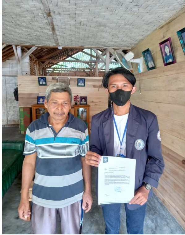
Gambar 2.2 Meminta Izin Kepada Pemilik UMKM Gula Merah