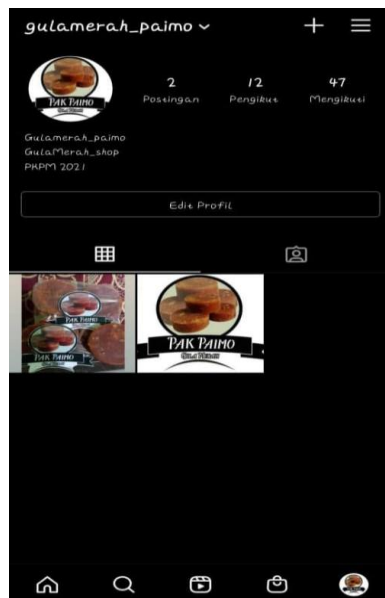
Gambar 2.4 Pembuatan Logo Pengemasan dan Akun Instagram