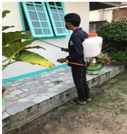
Gambar 2.6 Penyemprotan Disinfektan

Disinfektan merupakan proses dekontaminasi yang menghilangkan atau membunuh segala hal terkait mikroorganisme (virus dan bakteri). Saya membuat cairan disinfektan dari beberapa campuran yaitu wipol, baycline, dan superpel.